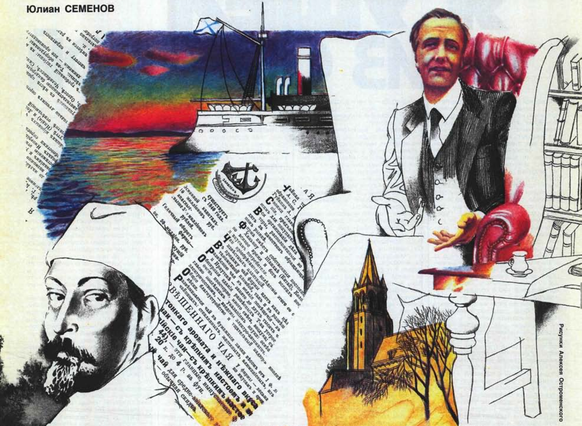
Рисунки Алексея Остроменского