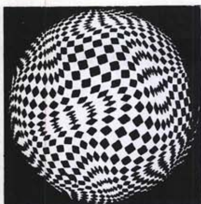
Под редакцией гроссмейстера Виктора ЧЕПИЖНОГО