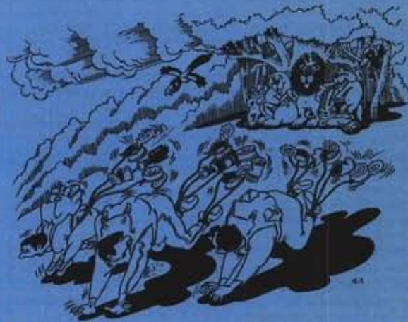
Рисунок Валентина Дружинина, Запорожье