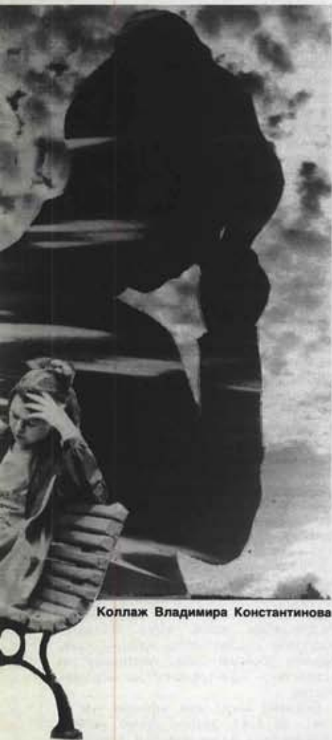
Коллаж Владимира Константинова

В обильной редакционной почте явно вырисовывается два круга проблем. К первому относятся вопросы сексуальной морали и любовно-брачно-семейных отношений. Ко второму — вопросы брачно-семейного законодательства вообще, и алиментного в частности.