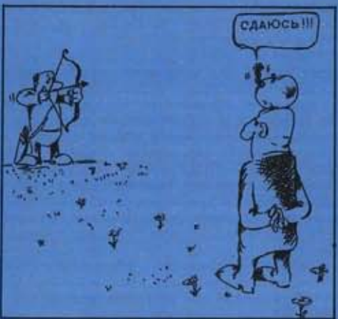
Рисунки Игоря Новикова, Москва