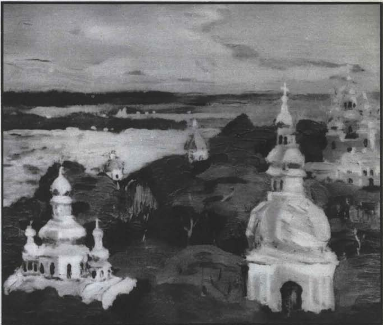
Киево-Печерская лавра. 1914 год.