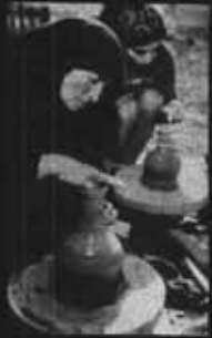
Фотоочерк о Дагестане.