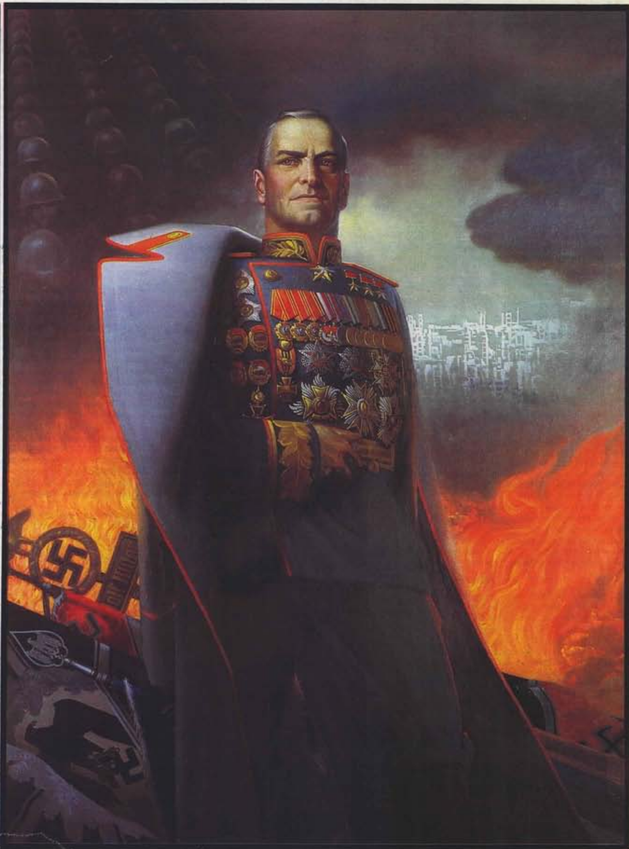
К. А. Васильев. «Маршал Советского Союза Г. К. Жуков».

Запись в «Личном дневнике пребывания на фронте»: