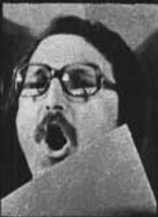
Клуб «Музыка с тобой». Кто заглушает песню?

Подписка на «Смену» не закончилась, она продолжается. Вы можете выписать журнал в любом почтовом отделении, в агентстве «Союзпечати» до 1-го числа предподписного месяца. В розницу журнал поступает в ограниченном количестве.