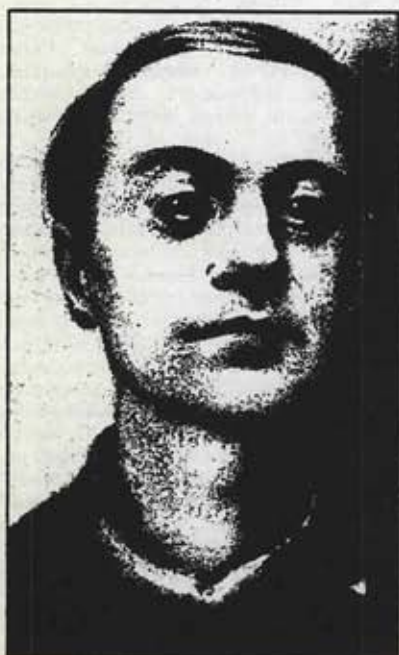
Автопортрет. 1934 год.

В се мои познания, составляющие главный стимул к жизни, оказались провинциальными в сравнении с общей культурой Москвы. Следовало сделать исключение лишь некоторым несомненным авторитетам, поразившим мое воображение еще в начале первого знакомства с историей искусства. Меня очень занимали флорентийский и римский периоды творчества Леонардо да Винчи. Восхищение великим мастером возникло у меня в ранние годы, еще свежо было ощущение крови на моих пальцах от невинного голубя, которого мы с одним товарищем секретно оперировали во имя славы Леонардо да Винчи — анатома в медицине и анатома в форме искусства. Этот эпизод, его влияние на долгие годы зародили мысли о необходимости подвигов и жертв во имя осуществления прекрасного идеала в творчестве.