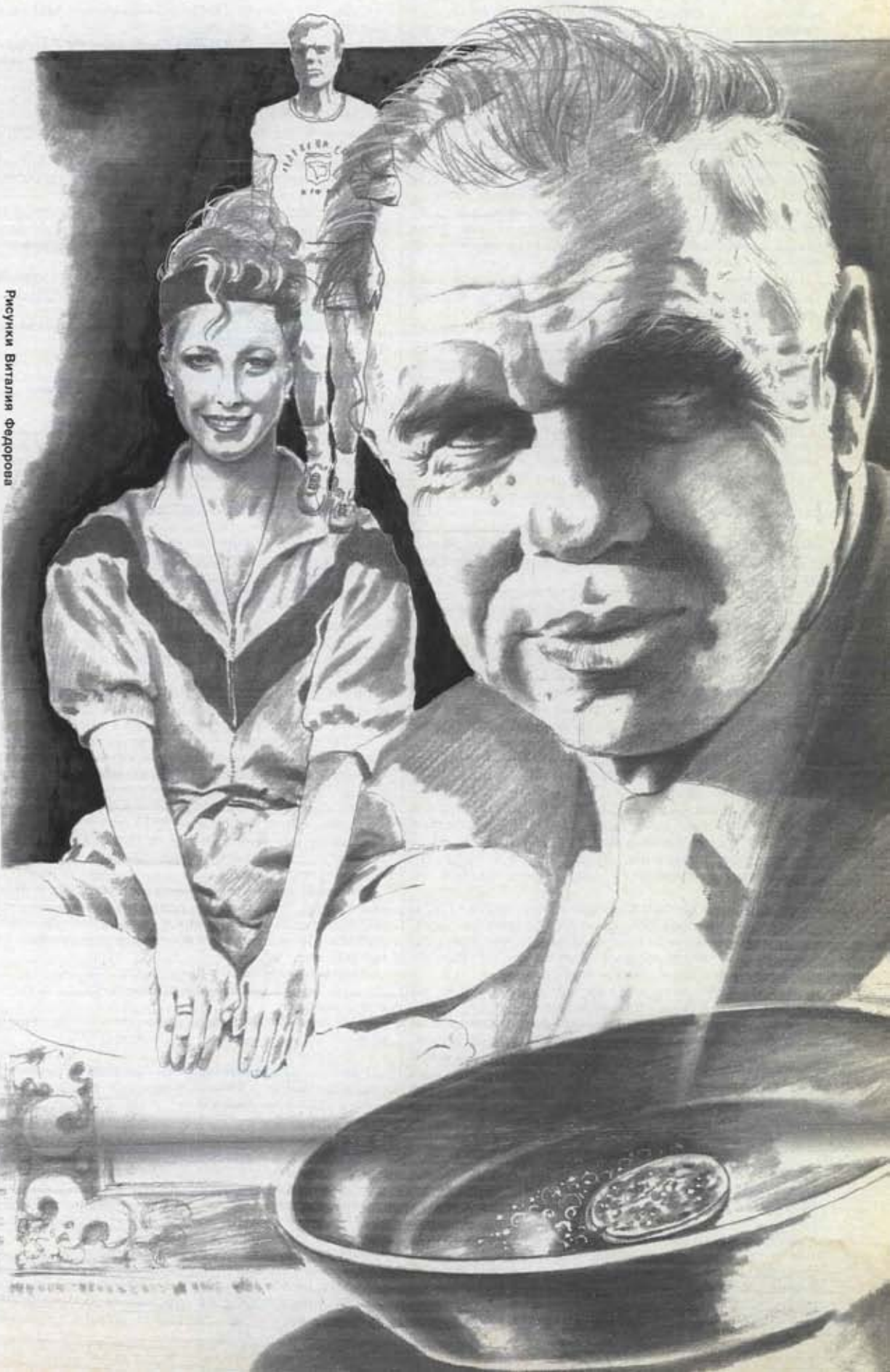
Рисунки Виталины Федоровой