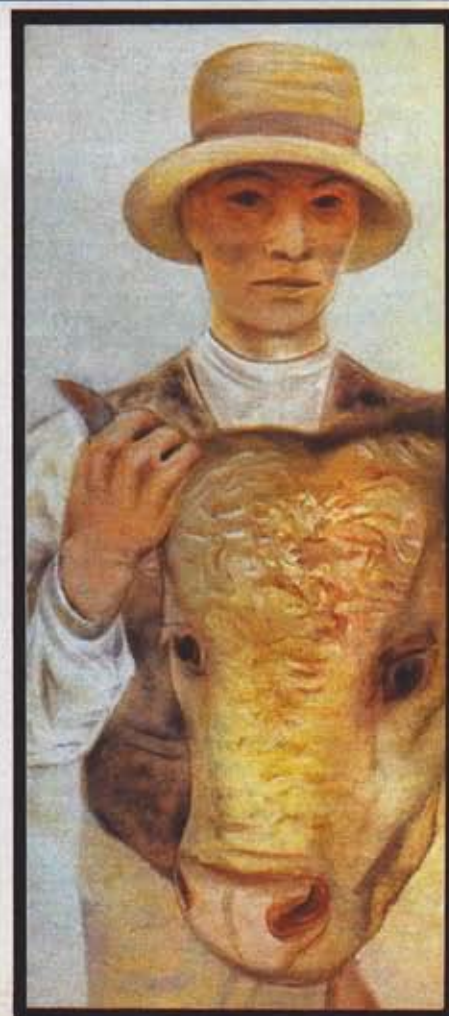
Крестьянин с коровами. (Фрагмент.) 1937 год.

Все остальные изучения, помимо воспитательных основ культуры XV и XVI столетий, были второстепенны. Может быть, и вернее было бы сказать, что за тот небольшой срок, который я пробыл под руководством моего любимого учителя Чижского, дальше продвинуться не мог — в силу обстоятельств, прервавших наши занятия. Этим кругом строго ограничивается моя благодарная память к нему. От него первого я усвоил дух Ренессанса и, впоследствии имея возможность проверить и углубить эти знания, соприкасаясь с оригиналами, открыл в себе чувства, возникшие вначале благодаря вмешательству его серьезной и очень одаренной педагогической натуры.