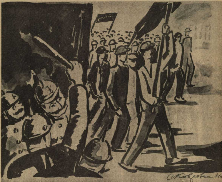
РИС. С. НОВГОВСКОГО