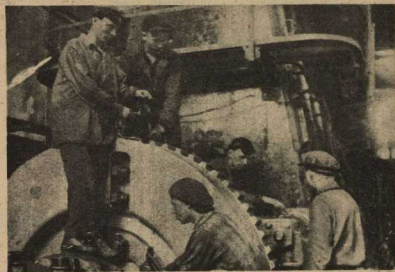
Героическую борьбу по выполнению пятилетия провела комсомольская бригада «Русский Дизель», среди которых отличившаяся комсомольская ударная бригада коммунистического цеха по сборке дизелей. На снимке: бригада комсомольцев за работой.

Это было давно. Это было в марте. Это было в те дни, когда зима грозилась республике заносами, бурями и суровыми ледяными днями.