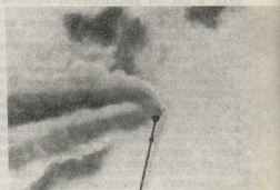
7. Размеренный гул станков прерывает резкий гудок — обед.