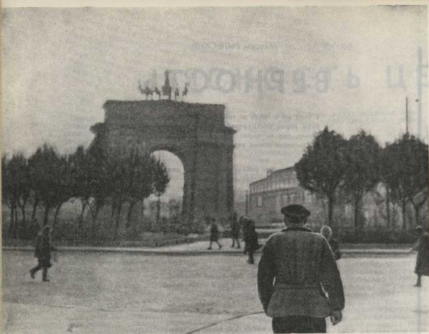
1. Было обычное осеннее утро. Медленно поднимался над Ленинградом лёгкий туман, слышались звонки первых трамваев, дворники заканчивали уборку улиц. Но для Виталия Смирнова, молодого комсомольца из-за Нарвской заставы, это утро было необычным.