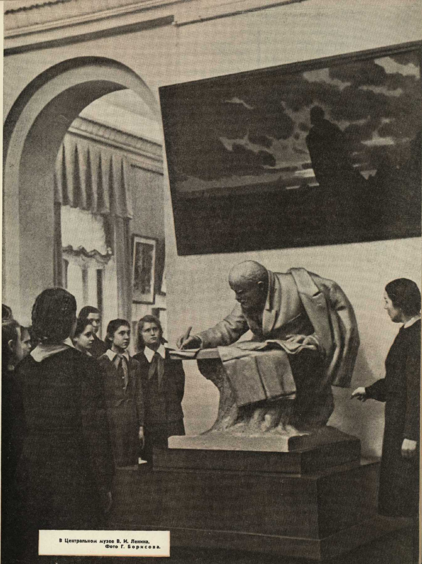
В Центральном музее В. И. Ленина.