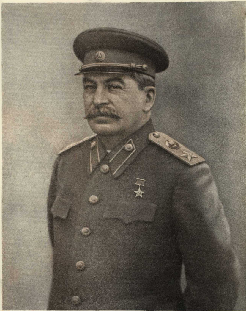
Председатель Совета Министров Союза ССР Генералиссимус Советского Союза И. В. Сталин.