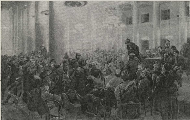
«Выступление Ленина на II Всероссийском съезде Советов». С картины художника Серебряного

В Смольном мы застав шумную, многолюдную толчею. На вечер назначалось заседание меньшевистско-эсеровского ВЦИК совместно с делегатами II съезда Советов. Целью этого заседания было «обработать» делегатов и сорвать назревшее воору-