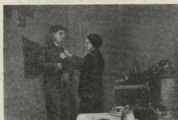
2. Сегодня он впервые выходит на работу к станку. И, поправив шарф на шее сына, мать проводила его в это утро так же, как вспоминала пять лет подряд провала мужа: «Счастливей работы!»