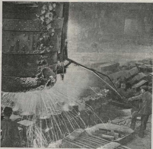
Резлинка стали на заводе «Серп и молот».

Он рассмеялся весело и совсем молодо: — Был бы до сих пор санитаром.