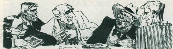
Главный бухгалтер отобрал у всех деньги и собственноручно стал их делить заново...