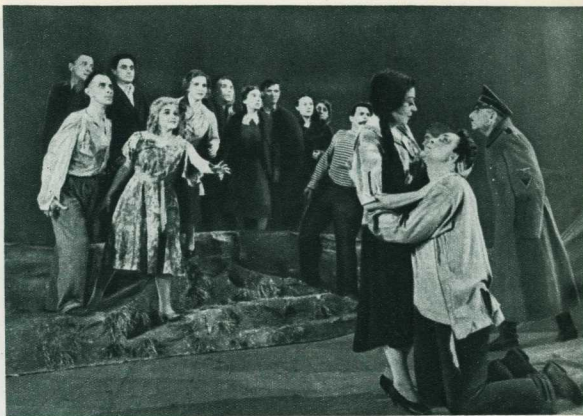
Сцена из спектакля «Молодая гвардия». Прощание молодогвардейцев перед расстрелом.

«Берег реки. Петя с товарищами улит рыбу. Гимназистка с аккуратно залеплёнными комочками приближается к юным рыбакам. Сцена эта построена в традициях классического танца. Сочетание современного реализма,