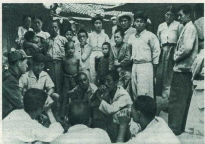
Бойцы Народной армии проводят беседу с населением в освобождённом районе.