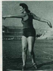
Чемпион мира в метании диска Нина Дубадзе.