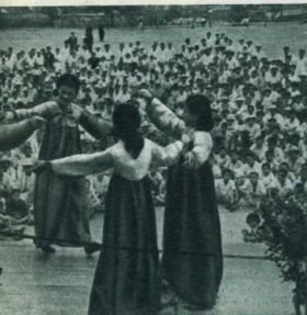
С бойцами в освободившийся город прибыли артисты.