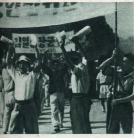
Процессия в честь выборов народного комитета.