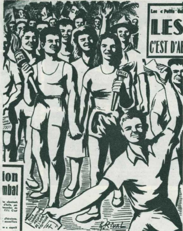
Рисунок французского художника Риваля «Международный слёт молодёжи в Ницце», помещённый в иллюстрированной газете «Авангард» (Франция). На фронтонах и знамёнах, которые несут юноши и девушки, начертано по-французски и по-итальянски: «Мир», «На оккупированных землях — строжайшее запрещение автомата».