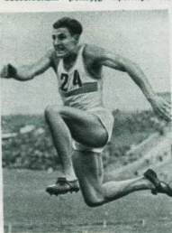
Леонид Щербанов делает рекордный прыжок.

Первым чемпионом Европы 1950 года стал двадцатипятилетний москвич Леонид Щербанов. Он выступал в одном из сложных видов лёгкой атлетики — тройном прыжке. Спортсмен должен сделать прыжок, не останавливаясь, три прыжка в длину. При этом во время первого толчка на ногу приходится огромная нагрузка — около 700 килограммов. Только исключительная кратковременность этого движения (0,11 — 0,12 секунды) позволяет выдержать такое напряжение. Минувшим летом Леонид Щербанов установил новый, выходящий за всеобщий рекорд, прыгуна на