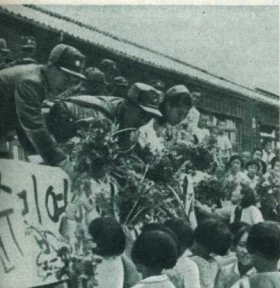
Проводы на фронт.