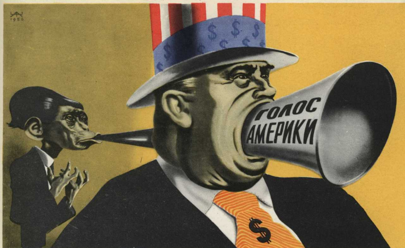
Фотомонтаж А. Житомирского