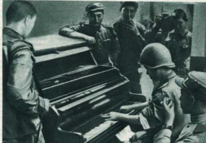
В перерыве между боями.