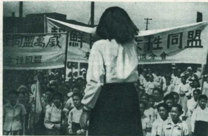
Митинг женщин в защиту мира в Сеуле.