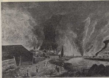
«Пожар Москвы в 1812 году. Со старинной гравюры».

Идут годы. Всё шире, всё выше разветвётся Москва. Великие русские люди украшают её бесмертными творениями. Москва принимает в себя Жуковского и Пушкина, Грибоедова и Державина, Герцена и Белинского, Суворова и Чапаевского. Здесь проводит свои юные годы Достоевский, здесь умирает Гоголь. В Московском университете учатся и