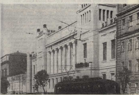
ЛЕНИНСКИЕ МЕСТА В МОСКВЕ. На этой странице мы воспроизводим снимки нескольких исторических мест в Москве, связанных с жизнью и деятельностью В. И. Ленина. Первый ряд (слева направо): Государственная библиотека СССР имени В. И. Ленина (бывшая Гуманцевская публичная библиотека), где