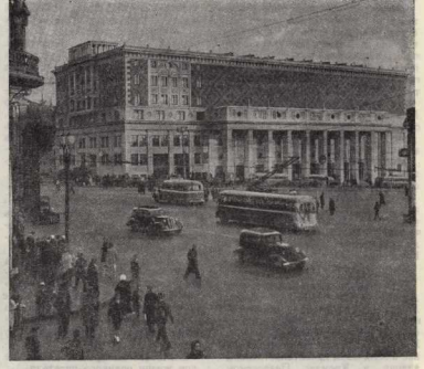
Площадь Маяковского — фото Н. Грановского.