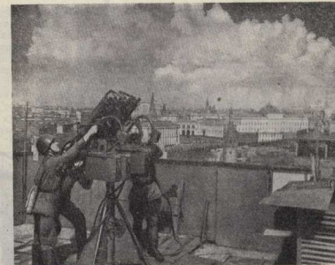
Москва 1941 года. На старом небе.

И Москва не та, и отношение к Москве иное.