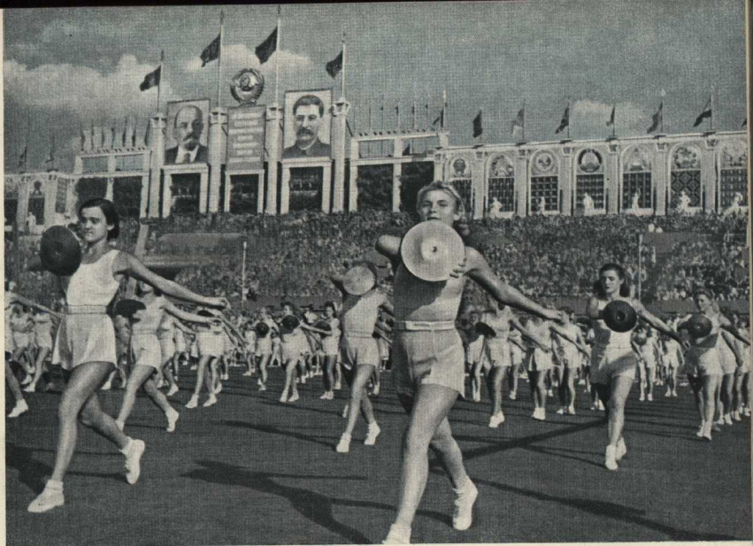
На Всесоюзном параде физкультурников 1947 г. в Москве.