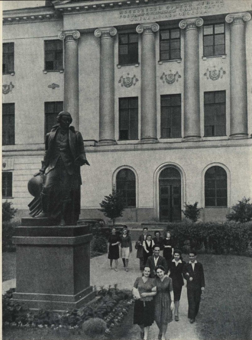
Московский Государственный университет имени М. В. Ломоносова.