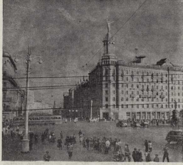
Площадь Пушкина — фото Г. Борисова.

После смерти нам стоять почти что рядом; мы на Печать, а на м. Площадь Маяковского — одна из центральных площадей новой Москвы. И имя поэта теперь стоит рядом с другими именами замечательных деятелей русской культуры.