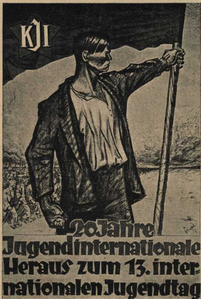
Плакат верманского комсомола к XIII МЮД'у

Сам деятельно работая над изучением Ленина, Россен продвигал в мас-