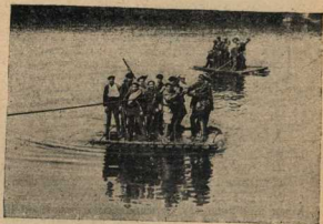
СПРАВА: Переправа на плотах

быть сбит! Передавая дальше! и вторичные десятикратно, повернувшись к рощу.