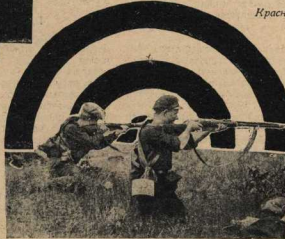
Стрелки в цепи