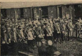
(Перенос со стр. 7)

неудержимо неслись в едином стремлении выбить врага. Трепачи наизюbito пулеметы—деревянные трещотки — и под их прикрытием шли чины. Воображение рисовало настоящих бой, кровь вскипала в молодых жилах, и крепко сжатые губы как бы не давали чувствам и мыслям вырваться наружу. Я пробрался вадь дщи наверх, на выступ горы, где собрался штаб. Отсюда можно было окинуть взглядом пладаром военных действий. Неприятель стоял на сухие леса, идущего зигзагом вадь противоположного берега, и стрелял в упор наши батальоны. Второй батальон форсировал реку. Бойцы шли гуськом для того, чтобы огонь противника не нанес бы ни большого урона, и, оступившись, они не смогли бы отступить. Командир полка, выходя из леса, они продвигались все дальше и дальше, оттесняя противника в гущу леса. Тогда-то мы увидели, покачивавшихся нам позорным, наступление первого батальона. По настоящему увлечены боем, батальон бежал по мосту, забыв, что по плану моста не существует, что, отступая, несутся огни взорава. И на другом берегу первый батальон шел густыми колоннами, представляя собой хорошую мишень для неприятеля.