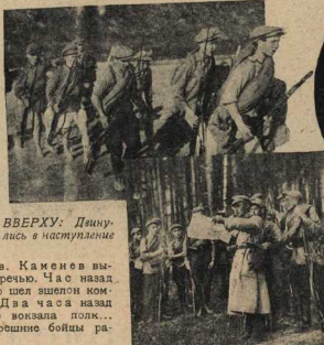
ВВЕРХУ: Двинулись в наступление

На привале ели «малюти бутерброды и пили чай в соседней деревнянке, окружая нас плотной стеной сбитой рязьей борщевки, как дровосек при рубке