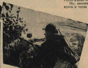
СПЛЕА: Стрелок под прикрытием в ожидании атаки