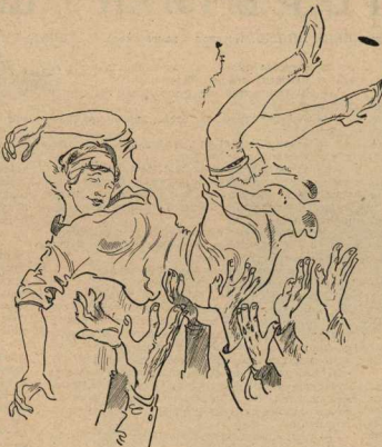
Схватили бедняженку и давай покидывать...

— Вот мы с Шуркой так уж выиграли! Вовочка очень деловито: