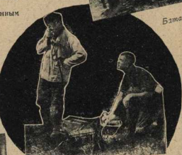
Первое доношение о враге