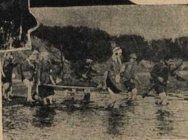
Красные сестры переносят раненого под неприятельским огнем