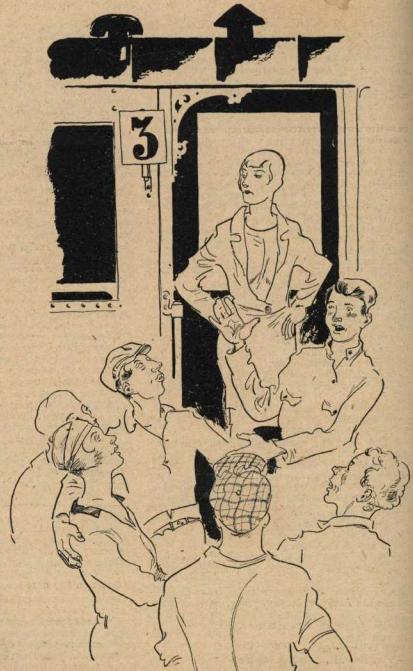
...Второй звонок ограничивает и окрестности...