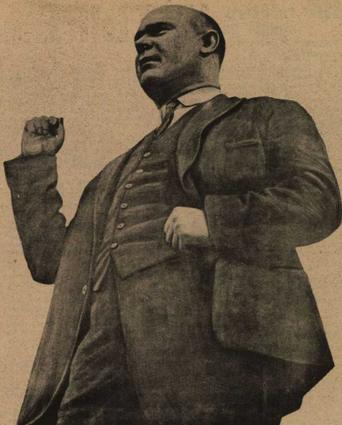
первомайская демонстрация в Берлине — выступление тальмана