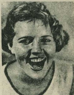
надписи из фильма «Наши девушки»

Остается пожелать лишь, чтобы первый опыт шефства комсомола над «молодежными» фильмами не прошел бесследно для нашего кино-производства. Наглядным доказательством его целесообразности и является подшефная комсомола — «Наши девушки».