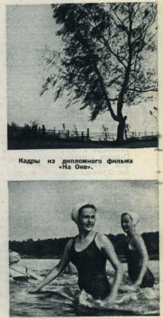
Кадры из дипломного фильма «На Оке».