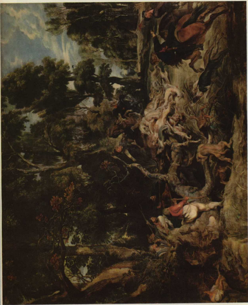
Петер Пауль Рубенс (1577—1640).