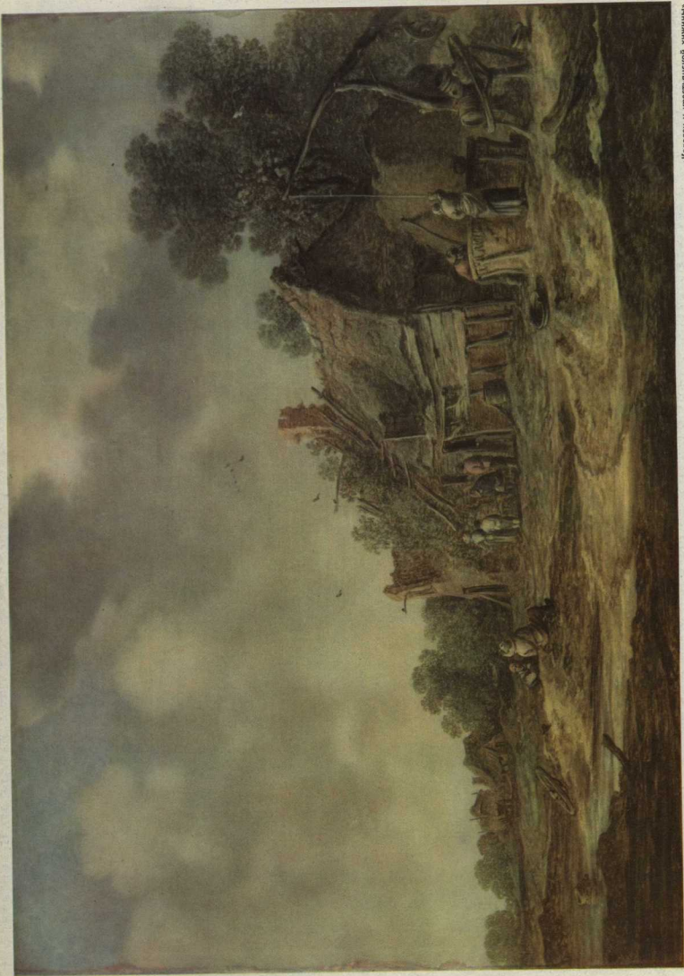
Ян ван Гоелен (1596—1656).

«Ногорцы у ирестаньской химимы», Дрезденская галерея.