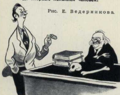
Рис. Е. Ведерникова