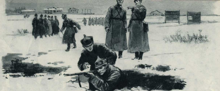
Рисунки П. Пинигосевича.