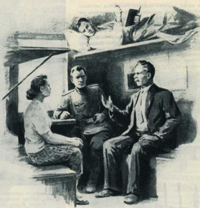
Рисунок Л. Котлярова.

Как водится в поездах дальнего следования, они быстро познакомились. Пожилой бухгалтер из Благовещенска вез в Москву годовую отчет, заборовавший — майор пограничных войск — спешил на учебу в академию, а молодой инженер и еще более молодая чертежница ехали на курорт — они недавно поженились, и длительное путешествие из Комсомольска-на-Амуре к Черноморскому побережью было у них судьбиной.