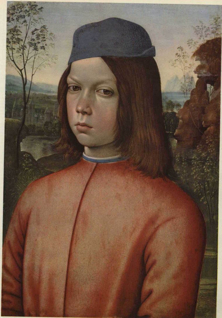
Бернардино Пинтуриккио (1455—1513).

«Портрет мальчика». Дрезденская галерея.