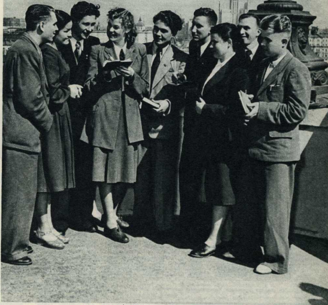
В дни Всесоюзного совещания работников промышленности в Кремле встретились молодые нефтяники, металлурги, машиностроители, шахтеры. Они обменялись адресами, чтобы завязать дружескую переписку.

С молодыми людьми, ищущими себе дорогу в жизни, я и хотел бы поговорить через молодежный журнал «Смена». Когда-то и передо мной вставал волнующий вопрос: кем быть? Помню, в 1936 году, когда я еще учился в седьмом классе, преподаватель привез нас на Харьковский тракторный завод. Это была обычная экскурсия, но она-то и