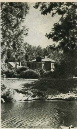
Домик в Мичуринске, где жил И. В. Мичурин.