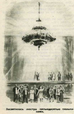
Засетились лотра пльюдностью тельными.

Человек с тех незапамятных времён, когда начал трудиться, ведёт постоянную и упорную борьбу с природой. На протяжении тысячелетий люди отбивались у природы её «слары», приспособляли природу к своим вущам, передавали её. Цветущие стада, тучные нивы, огромные стада скота, окружающие нас теперь,—это плоды колоссального труда человека. Многочисленные культурные растения, породы сельскохозяйственных животных, дающие