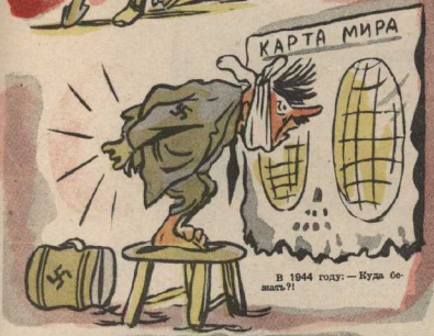
В 1944 году! — Куда бежать?!

— Куда вы меня тащите: воя и одной ногой стою в Москве. — Молчи, дурак: другой ногой будешь маршировать на Восточный фронт!