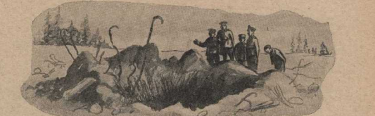
Члены комиссии с изумлением смотрели в глубокую дымящуюся воронку.

Население видео своего «главу» только в тот час, когда Ерофеев ехал в управу или возвращался из управы. Люди глядели его сторону новизни, пугались и подстригивали хвостами, высокую фигоновую брычку, на кучера и на охранника. Несмотря на это, Ерофеева как бы не замечали. А между тем он иногда встречал знакомых людей, с которыми ему удавалось дружески поговорить. Ему случалось встречать приятелей, которые приходили к нему до войны поиграть в шахматы, выпить и закутить на-