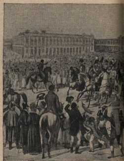
«Въезд союзных войск»