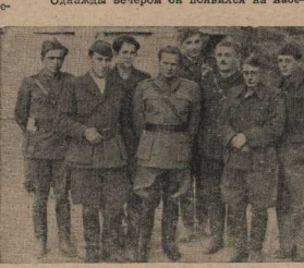
Маршал Иосип Броз-Тито среди членов Верховного штаба Народно-освободительной армии. Слева направо: Иосиф Рибар, Александр Ранкович, генерал-лейтенант Милован Джилас, маршал Тито, Сретен Жуйков (Черил), Андрия Хебранг, Моша Пишче и Эдуард Кардеж (Бел).

Привыкнув вместе со мной в Советский Союз член военной миссии генерал-лейтенант Милован Джилас находится в армии лишь с 1941 года. До этого он прошел большую школу подпольной антифашистской борьбы. Еще в 1933 году за участие в организации против реакционной диктатуры короля Александра Милован Джилас был заключен в тюрьму. Он находился в заключении три года. Благодаря изобретательности и большому активизму, он с еще большей активиз-