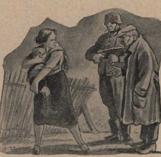
— Ну, кого же первой, — вас или дочку?..

на него с мрачной улыбкой, сам открыл ему дверь автомобиля, и когда Ерофеев нетвердыми шагами прошёл в калитку, с удовлетворением кинула головой. Теперь всё было в порядке. Теперь этот человек связан кровной порукой с немцами. Командант окончательно уверился в этом, когда два дня спустя в окно флигеля, где жила Ерофеев, ударила пуля и спалошился, пролив бок пузатого самовара.