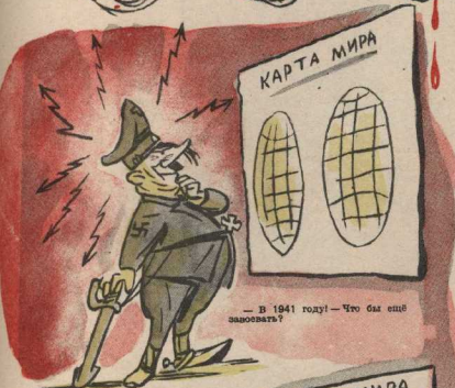
— В 1941 году! — Что бы еще завоевать?