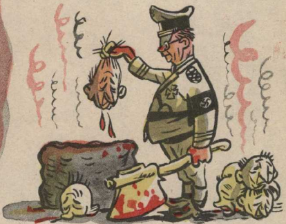
1. Пессимисты, не верящие в победу «фюрера», терзают голову в Берлине.