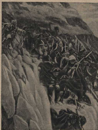
«Переход Суворова через Альпы». Картина художника В. И. Сурикова.

Слава русского оружия — мировая слава. Александр Суворов, разбивший «испан-рыцарей» Тевтонского ордена при Чудском озере, на пятый столетий оправдал Россию от вторжения немцев. В XVIII веке Пруссия вновь устремилась на Восток. Прусский король Фридрих II, чьи «человечески свободные» ханжеские философы рассчитывали на легкую победу. «Москвитинские» «поборники» — суть, далее о дяде, «блестяще-роковые» войны не могут сплотиваться.»