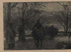
Воинская часть Народно-освободительной армии Югославии на марше.

Уставши и четники генерала Михайловича из кожи вон лезут, чтобы высунуться перед своим немецким хозяином, продают его интересам, терзают и мучают тех, кто попадает к ним в лапы. Но ничто сильней не возмужает человека, из одного патриота, который бы не видел и не понимал, куда клонит изменения. Югославские крестьяне, работавшие в партизанских частях на сторону Народно-освободительной армии, соединили свои судьбы с её борьбой. И здесь, в горных селениях и городах, в жесточайших боях с немцами и их продолжками немцами, возрождается из праха, пепла и крови молодая Югославия — народная, свободная, трудолюбивая, завоевывающая своё право на жизнь.