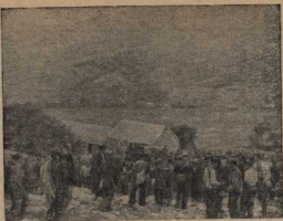
Партизанский отряд в Даламации собирается в поход.