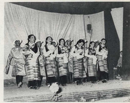
Большим успехом пользуются выступления тибетских вокальных ансамблей.