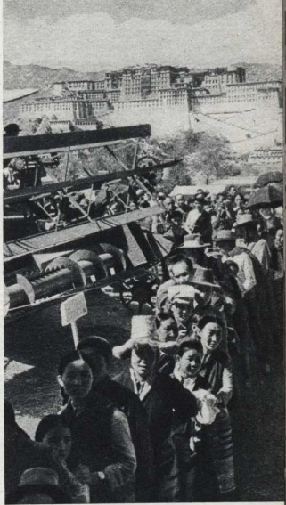
На тибетской земле появились тракторы и комбайны. На снимке: сельскохозяйственная выставка в Лхасе.

В Лхасе созданы антономические мастерские и небольшой железнодорожный завод. Вспыхнул электрический свет. В этом городе повсюду можно увидеть пионеров с красными