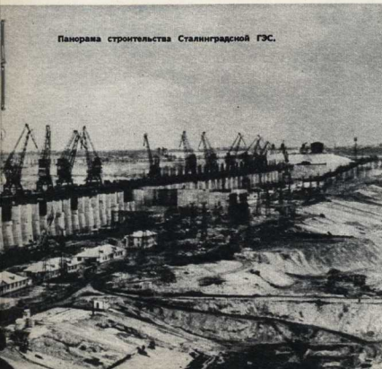
Панорама строительства Сталинградской ГЭС.