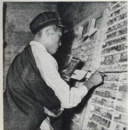
В Лхасе начала выходить первая в истории Тибета печатная газета «Новости», которая издавалась в местной типографии.

Нашему отряду приказали прийти на революционную базу вблизи китайско-бирманской границы—город Цзянчунь. Туда ставались все партизанские силы, чтобы бросить их на город Дзянчунь, аванпост гоминдановцев. На подступах к Дзянчуню мы услышали орудную канонаву. Никто из нас не слышал до этого орудной стрельбы. Я думаю, что