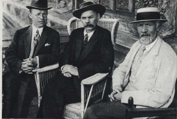
Фото М. С. Наппельбаума. Публикуется впервые.