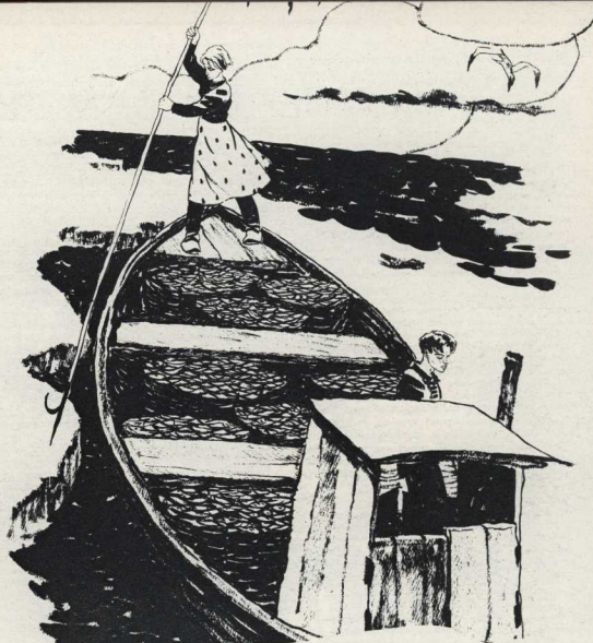
Рисунок Ю. Вечерского.