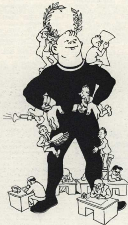
Рисунок Е. Гурова.

Неужели нельзя собрать хорошую футбольную или хоккейную команду из работников? Пусть на первых порах она не добьется блистательных успехов, но зато команда будет по-настоящему своя, комбинатская. И даже небольшие победы одерживая ее, принесет больше радости, чем самый громкий триумф фальшивых монтеров и слесарей.