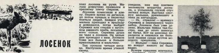
Рис. Д. Павловара.