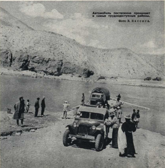
Автомобиль постепенно проникает в самые труднодоступные районы.

Землю мы пахали рогами горных козлов и били ичмень. Из него делалась цзамба — любуемая пища тибетца. Приготавливается она