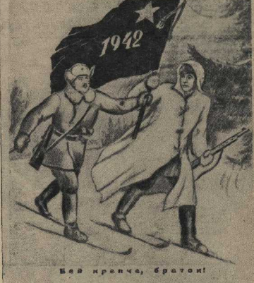
Вся иреча, браток!

— Всем гранатов! — услышала бойцы слова командира.