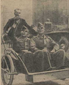
Гитлеровцы разорили и ограбили Польшу. Голод и нищета стали постоянными спутниками сотен тысяч людей. Вот нередко встречающиеся картины: поляк, потерявший надежду получить работу, прятается в кривом. За яростно вопит он самовольных немецких учтеров по улицам Варшавы...

Осенью 1939 года много польских солдат и офицеров, попавших в плен, обречены на кровавые пытки, прошли по шоссе, которое ведет к Залешкам, пробирались горными тропинками через Карпаты, чтобы воевать с немцами на других фронтах. И отряды этих вооруженных польских зачинщиков свободы Франции, сражались в Восток, сдерживали натпор наступающих немцев вблизи Дюнкерка, обороняли