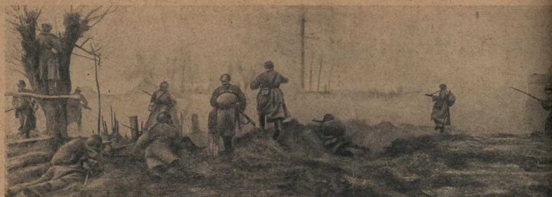
Бойцы идут в атаку. Со штыками наперевес ринулись они на врага, засевшего в населенном пункте М. (Западный фронт).