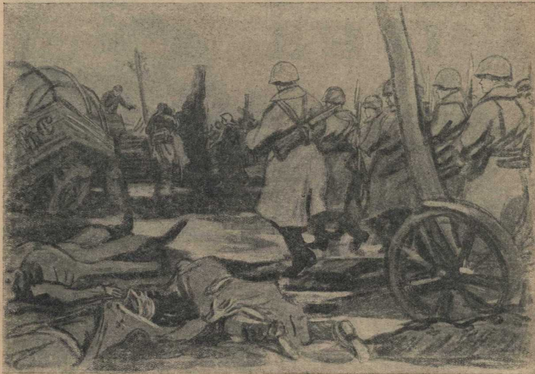
Из серии фронтовых зарисовок художника В. Горьева.

тей, эти патриоты сбрасывали с крыш «закапален», перья бросались на раскопанные обрушившихся домов, оказывали помощь пострадавшим.