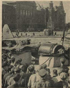
Сбитый на подступах к Москве фашистский самолет, установленный на одной из площадей столицы.