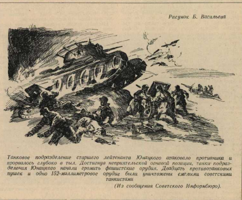
Рисунок Б. Васильева

Что вы, что вы, комманда закрыта до окончания войны... До победного окончания!