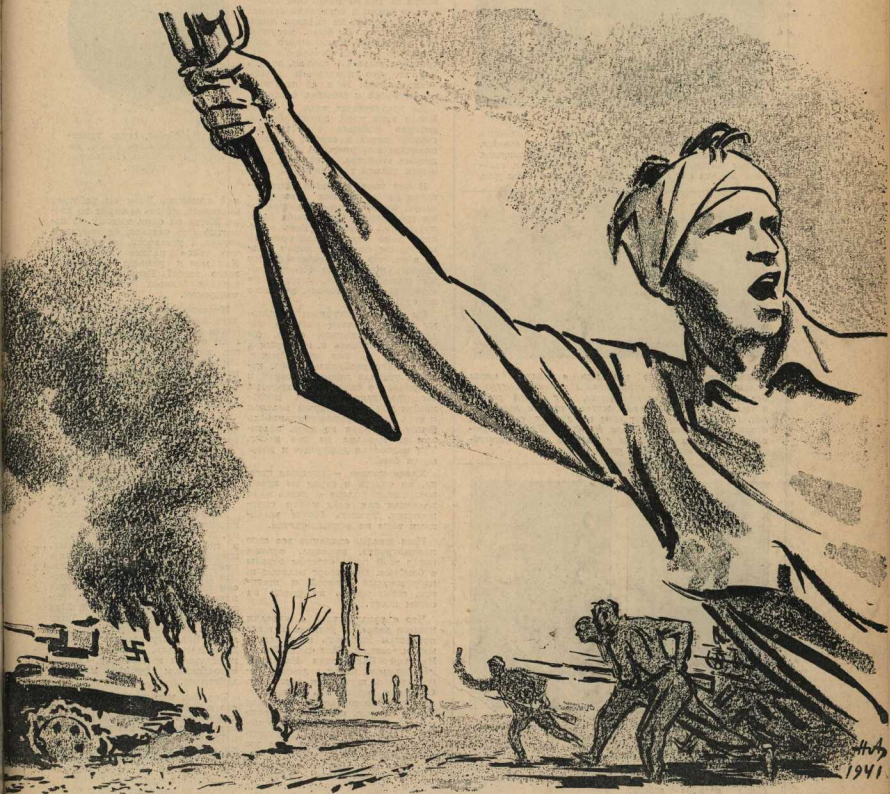
Рисунок И. Авакумова

За сожженные города и села, за смерть детей наших, за пытки, насилия и издевательства над моим народом и клянусь мстить врагу жестоко, беспощадно и неустанно.