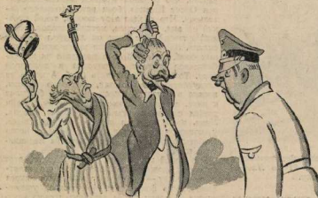
...Один старичок пытался подвязать самого себя за волосы, а другой жонглировал скитнером и коровой.

— Знаете что, ваше величество,— сказал барон,— мне кажется, что все наши руководители сошли с ума и только в сумасшедшем доме сохранялись еще здравомыслящие люди. Вернемся же туда лоскорок! И они вошли по дороге, объяснившись.