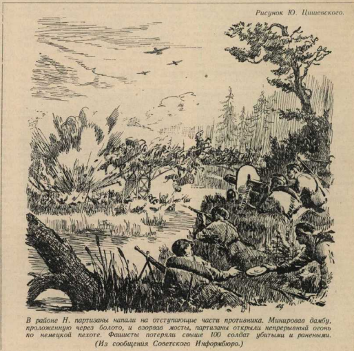
В районе Н. партизаны напали на отступающие части противника. Минирове дамбу, проложенную через болото, и взорвав мосты, партизаны открыли непрерывный огонь по немецкой пехоте. Фашисты потеряли свыше 100 солдат убитыми и ранеными. (Из сообщения Советского Информбюро.)

Вот и концы, друзья! Прощай, родина! Жива!