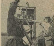
Наблюдательный пост занял себя жести на крыше дома.