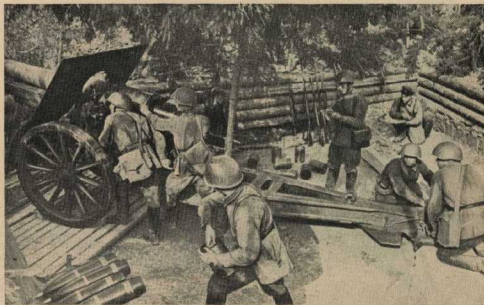
ДЕЙСТВУЮЩАЯ АРМИЯ. Артиллеристы ведут огонь по врагу.