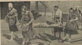
Днем девушки-старички-массинки учатся оказывать первую помощь раненым.