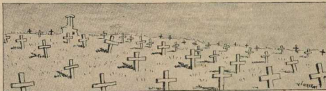
Для несогласных предоставляется «пожизненное пространство»...