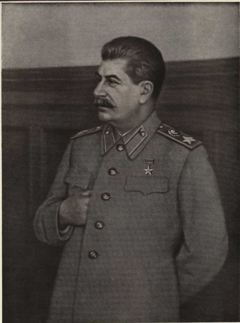
Председатель Совета Министров и Министр Вооружённых Сил Союза ССР Генералиссимус Советского Союза Иосиф Виссарионович СТАЛИН