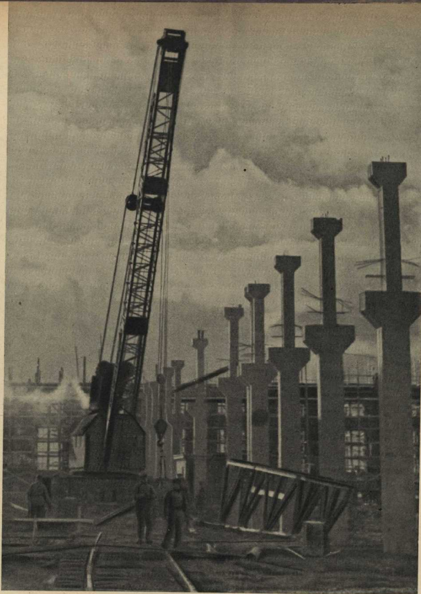
На западе страны бушевала грозная военная буря, а на востоке советский народ, твёрдо уверенный в победе над врагом, создавал новые предприятия социалистической индустрии. На с и м к е — одно из строителей 1942—1943 военных годов. Возведение прокатного цеха Челябинского металлургического завода.