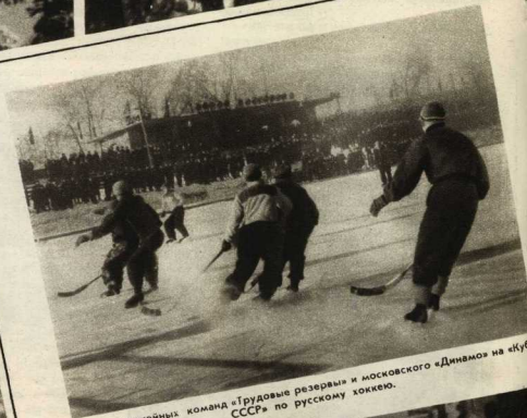
Встречи хоккейных команд «Трудовые резервы» и московского «Динамо» на «Кубок СССР» по русскому хоккею.