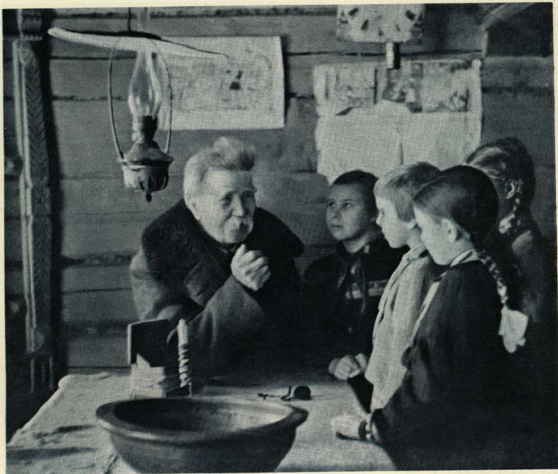
Завязывается продолжительная, увлекательная беседа...