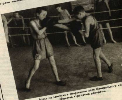
Юная секция бокса на занятиях в спортивном зале Центрального клуба общества «Трудовые резервы».