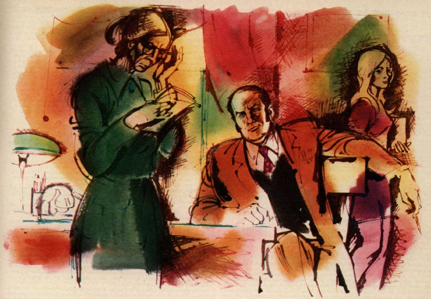
Рисунок Марна ЛИСОГОРСКОГО