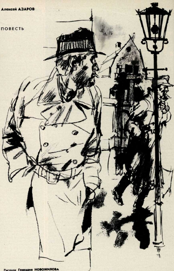
Рисунок Геннадия НОВОЖИЛОВА

Сейчас Цолмер живо напоминает мне старого будаюга, размышляющего, вцепиться ли ему в здоровенную кость. С одной стороны, собака велика; с другой — и зубы уже не те и помойка по задним дворам полна объедков.