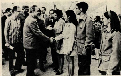
В ШКОЛЕ-ИНТЕРНАТЕ ИМЕНИ В. И. ЛЕНИНА.

В еликая вещь — телевидение! Ни моря, ни океанов, ни громадные расстояния — ничто не может помешать всемирному телевидению, и мы в конце января снова с благодарностью думали о всех тех, кто открыл нам окно в западном полушарии и пригласил на замечательный, яркий праздник социалистического интернационализма.