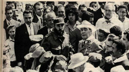
ЖИТЕЛИ ГОРОДА САНТЬЯГО-ДЕ-КУБА ПРИВЕТСТВУЮТ ЛЕОНИДА ИЛЬИЧА БРЕЖНЕВА ВО ВРЕМЯ ПОСЕЩЕНИЯ ИМ КАЗАРМЫ МОНКАДА.