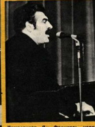
Композитор Ян Френкель исполнил свои песни так, как это может только он...

НАШ АДРЕС: 101457, ГСП, МОСКВА, А-15, Бумажный проезд, 14, ТЕЛЕФОН ДЛЯ СПРАВОК: 253-30-87.