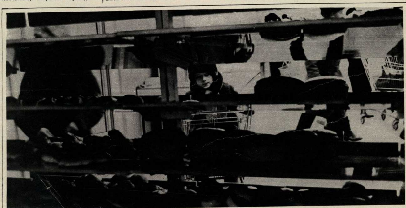
ЛЮБОпытство — НЕ ПОРОК.