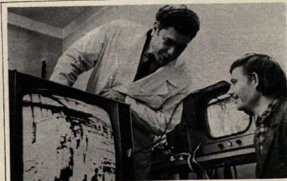
ВЕСЬ ЗАЛ НА ВИДУ.

Право же, это очень большое, нужное, просто необходимое дело.