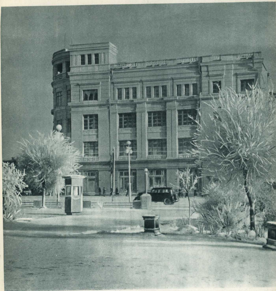
Сталинград. Новое отстроенное здание университета [вид с площади Павших борцов].