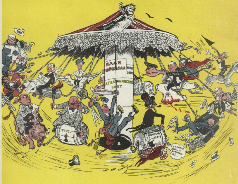
Рисунок И. СЕМЕНОВА