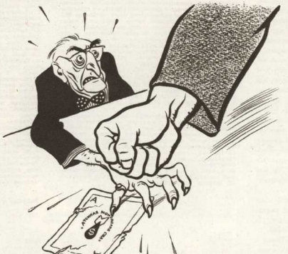
Рисунок Бор. Ефимова

Прежде всего, потому, что неядерная наука в России была работавшая перед заграждениями и всем заграждениями и не варили в гетто русские народы, русской науки. Восточных, грубо совсем не обесились передовой революционной наукой мысли учёных-интернационалистов, которые в то время не имели идеалистические представления о мире, преобладавшие официальной наукой, проповедующей идеологию, согласно царских шатрапов многие преципирующие открытия русских учёных, пропадавшие в никуда, идеями, которые умели сдуть их в идеалистические одежды, разумеется.