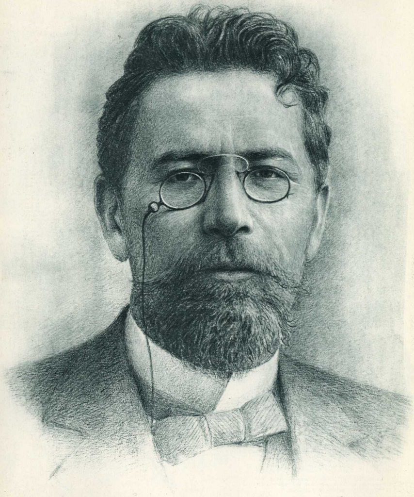
Антон Павлович Чехов.