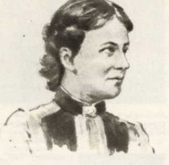
С. В. Ковальская.

Так в 1909 году телеграфировал знаменитый математик.