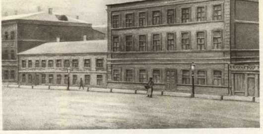
Дом Самойлова на Трубной улице в Москве, в котором А. П. Чехов начал литературную деятельность.

Исполнилось девяносто лет со дня рождения Антона Павловича Чехова — великого художника, отдавшего всю свою жизнь, весь свой могучий, жизнеутверждающий талант служению родному народу.