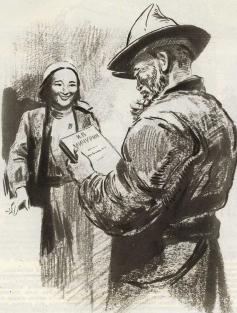
Самбу кашлянула, безвольно пошевелила губами, пальцы его привычно потянулись к редкой бороде...

поляну всадника. Присадиив коня, всадник крикнул: