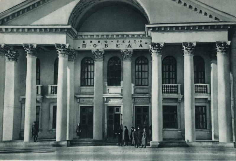
Сталинград. 1. Вновь построенный кинотеатр «Победа». 2. Проспект имени Сталина в Тракторозаводском районе.