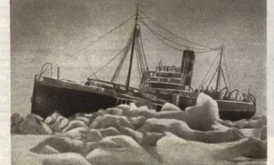
«Седов» во льдах.

Чувство долга перед Родиной, чувство советского патриотизма, высоко развитый советский человек, всегда брало и будет брать верх над всеми остальными. Никакие трудности не могут стать непреодолимыми препятствиями на пути советских людей, волевыми силами мысля о нашем светлом будущем — коммунизме.