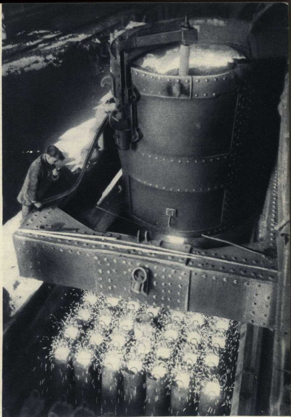
Разлив стали в мартеновском цехе Константиновского металлургического завода имени Фрунзе (Донбасс).

Свет. Свет, разрывающий тьму! Свет нашего мирного, всеозначающего труда. Свет нашей, вновь счастливейшей жизни. Свет, освещающий нашу волю и правду. Свет, от которого не спрячешь никакие международные махинации империалистических хитроумов. Свет, олодотворяющий поля Чехии и Болгарии, Польши и Югославии. Свет, скорость которого ещё не пережала человеческая изобретательность. Пусть же станет видимо далеко во все концы света!