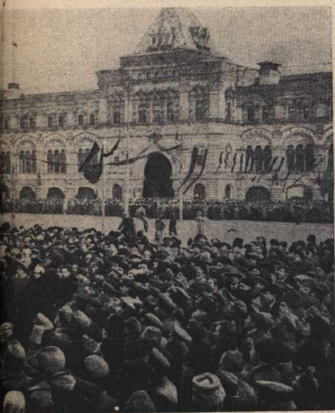
Ноябрь 1918 года.