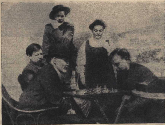
В. И. Ленин и М. Горького на острове Капри (1908 год)