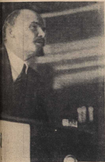
Июль 1920 года.