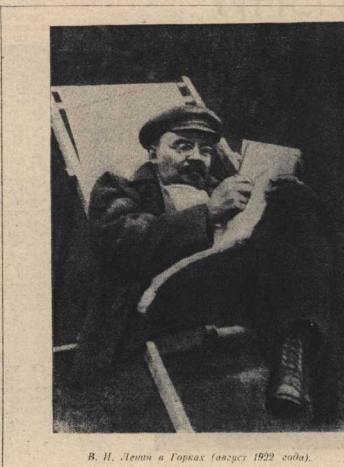
В. И. Ленин в Горках (август 1922 года).