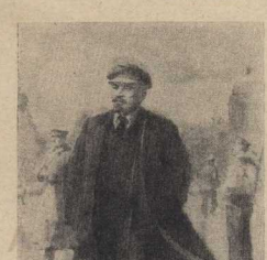
Рис. П. Васильева

гуманизма, долгу творческой ответственности взаимной выручки. Завбота о раненых бойцах, о детях, оставшихся сиротами, пострадавших от немецко-фашистских захватчиков, помощь семьям фронтовиков — комсомолец считал своим крестным делом.