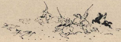
Рисунки Н. Муромова