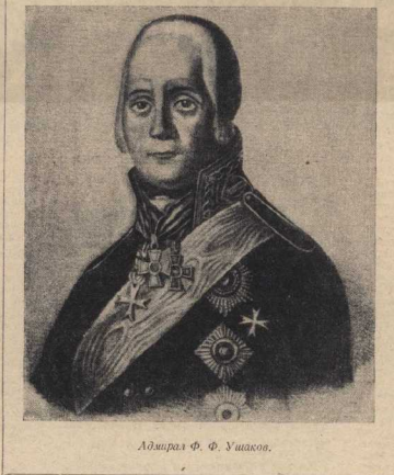
Адмирал Ф. Ф. Ушаков.

Ушаков ни на минуту не выпускал управление боем из своих рук. С мачты флагманского корабля почти не спускались сигналы «погоня» и «услышь аёчу».