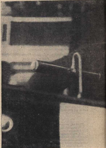
В. И. ЛЕНИН на трибуне.