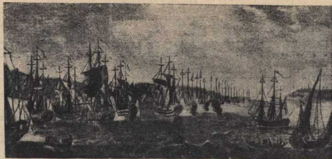
Сотка Черноморского флота в Босфоре в 1798 году. (По старинной гравюре).

Система воспитания и подготовки военного моряка парусного флота, заложенная Ушаковым, заключалась в достижении той «высокой степени исполнения эволюции», при которой «всякий спешит исполнить ему должное в полном виде, как належит». Матросы, по мнению адмирала, должны проявлять разумную инициативу, сознательно относиться к порученному заданию и обладать навыками «в спору и крайнему управлению всякого дела». Ушаков воспитывал у моряков русского флота чувства святыни, воинской чести и воинского долга.