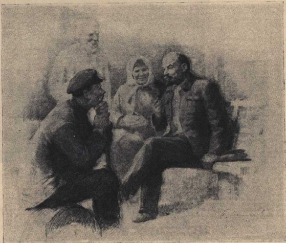
В. И. Ленин беседует с крестьянами.