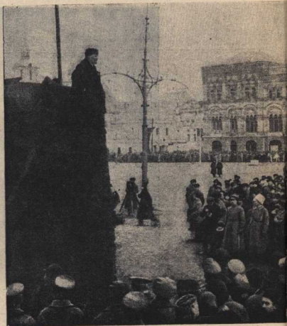
В. И. ЛЕНИН произносит речь на Красной площади Москвы.