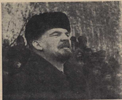
В. И. ЛЕНИН выступает на похоронах Я. М. СВЕРДЛОВА: Мерт 1919 года.

«Быть членами союза молодёжи значит вести дело так, чтобы отдавать свою работу, свои силы на общее дело. Вот в этом состоит коммунистическое воспитание. Только в такой работе превращается молодой человек или девушка в настоящего коммуниста. Только в том случае, если они этой работой сумеют достигнуть практических успехов, они становятся коммунистами.»