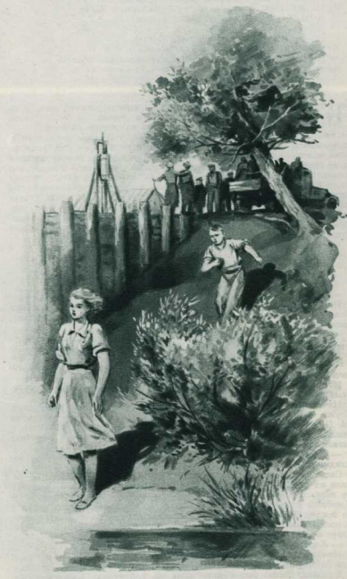
Киришка побоялся зимы. Зойка стояла на опустевшей песчаной носе, повернувшись лицом к ветру...

Утром погода не затихала. Ветер катил по небу пухлые облака, они гуделись на горизонте, освещенно блеле воет лучами раннего солнца. Умывшись из бочки, Киришка вышел на улицу. У краевой избу уже