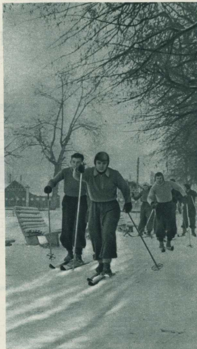
Лыжники завода «Карболит» готовятся и сдают норм на значок ГТО.