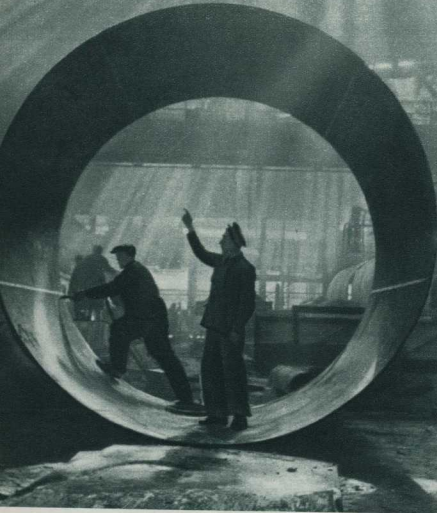
Уралмашзавод. Цех металлических конструкций.