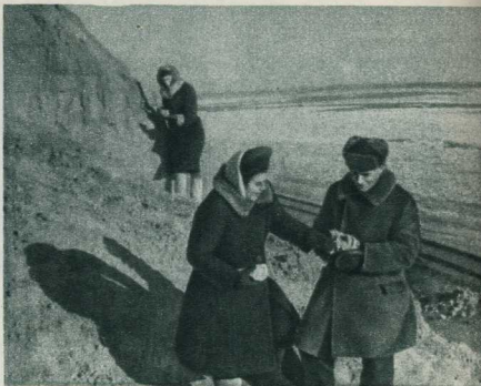
Техники-геологи отбирают образцы породы на правом берегу Волги.

Пройдёт немного времени, и десятки тысяч советских людей придут к стенам города, носщего имя великого Сталина, чтобы внести свой вклад в создание величайшего Волжского гидроузла, приближающего нашу Родину к коммунистическому завтра.