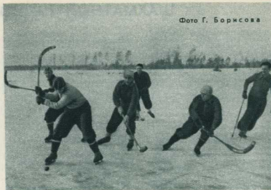
Заводская хоккейная команда на тренировке.