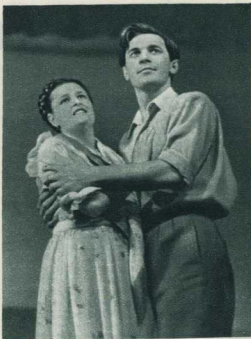
Финальная сцена. Снова Груня и Родион вместе... «...и эта любовь будет светлее, чище, крепче», — говорит Груня.

Думается, что именно в этом — в умении правдиво и полно скрупулезными средствами показать неразрывную связь личного с общественным, в умении ярко и образно раскрыть высокие общественные идеалы и всё душевное богатство советского человека — большая творческая удача молодой