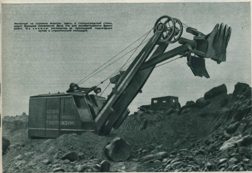
Несмотря на суровые морозы, здесь, в сталинградской степи, царит большое оживление. День ото дня разрабатывается фронт работ. На снимке: экскаватор за прокладкой подъездных путей к строительной площадке.