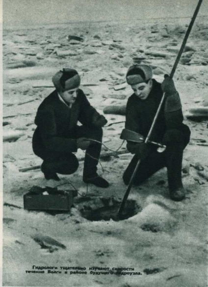
Гидрологи тщательно изучают скорости течения Волги в районе будущего гидроузла.