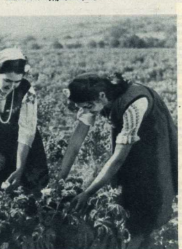
1. «Болгарская роза разносит дыхание нашей родины в самые далекие края земли», — сказал великий писатель Болгарии Иван Вазов. Тысячи гектаров в стране занимают розовые плантации, дающие ценное сырье для парфюмерной промышленности.

Зари новой жизни заглянула над Болгарией 9 сентября 1944 года, когда была свергнута фашистская диктатура. Девятое сентября 1944 года было первым днем свободы. Эту дату болгарский народ ежегодно отмечает как свой великий национальный праздник. Он с гордостью оглашается на пройденный десятилетиями путь и выдвигает на будущее скотит в будущее, и он знает это будущее прекрасно!