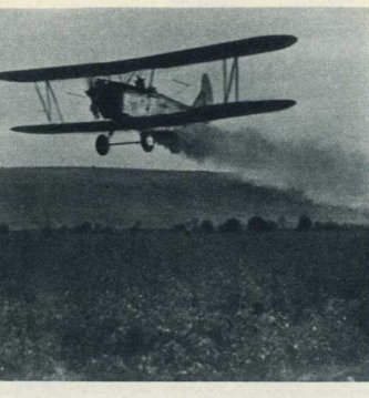
Таджинская ССР. Хлопковые поля обрабатываются с воздуха химическим препаратом.