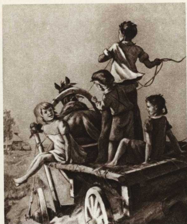
С. Куприянов. Одна из иллюстраций к повести Л. Воронковой «Солнечный денек».