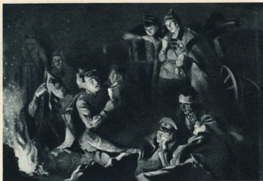
Н. Кузнецов. «Июсомольцы в годы гражданской войны».