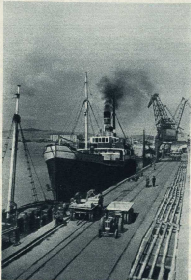
3. Болгария постоянно расширяет свою внешнюю торговлю. Все больше мараблей приходит в порт Бургас под флагами разных наций.