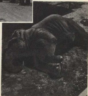
7. Спит умный Пунчи — добрый слон. Он крепко спит и видит сон. Но то, что видит он во сне, Не угадать ни вам, ни мне!