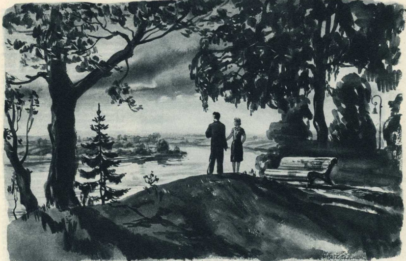
Рисунок Г. Храпака.

что из-за какой-то выдуманной Феей «мужской этики» я не могу даже быть ей просто товарищем.