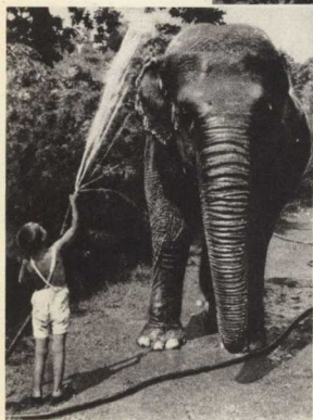
3. Для толстоногого слона Вода не слишком холодна.