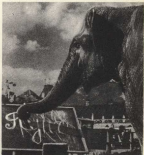
5. Какой тяжелый, слонный труд! Слон пишет, как его зовут, Во много раз трудней, чем нам, Дается грамота слонам.