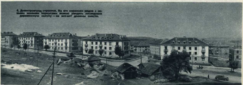
6. Димитровград строится. На его окраинах рядом с новыми зданиями можно увидеть последнюю деревянную халупу — ее жгут для отопления.