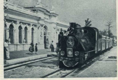
Днепропетровск. Детская железная дорога в Парне имени В. П. Чкалова. Поезд прибыл на станцию «Пионерская».