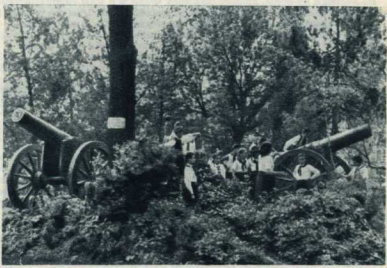
5. Плевна стала городом-музеем, где собрано множество священных для каждого болгарина реликвий. Они напоминают о братской помощи великого русского народа, дважды освободившего Болгарию. На снимке: школьники у старых русских орудий в одном из парков Плевны.