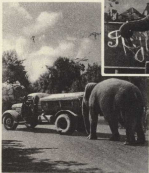
6. Зато, когда машина стала, Заглох мотор у самовала, Слон Пунчи запросто не прочь В беде водителю помочь.