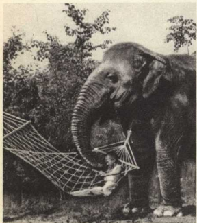
4. Качаться захотелось другу. Ну что ни Услуга за услугу!