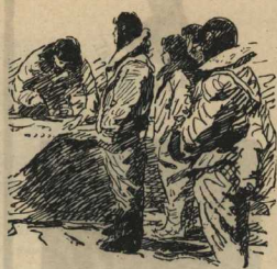
Летчики ждали, когда им прикажут вылететь...

Вот оно, небо. Да, над берегом самолеты! Не Бетя ли «еще» да помощь? Переворот...!