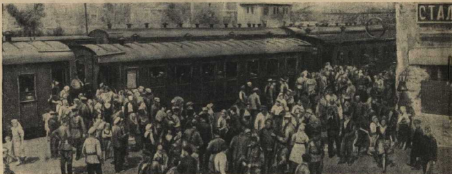
Сталинградское утро — это новые десятки вагонов, в которых приезжают молодые строители, это — начало напряженного