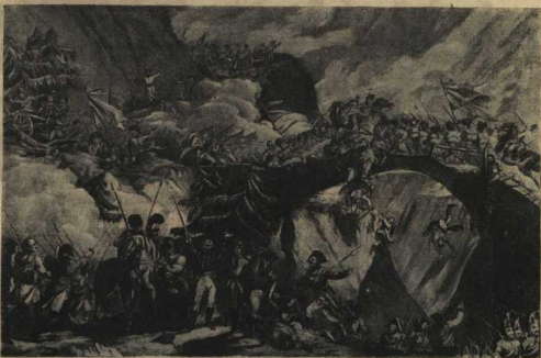
Переход Суворова через Альпы. С картины худ. Поттера.

Наступательные традиции в крови нашего народа. Дело армейского командования — в духе этих традиций воспитывать кадры молодого офицера. Ибо только наступательные мы окончательно сломаем врага и добьемся полной победы.