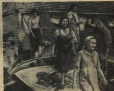
...А здесь, в подбитом немецком самолёте,