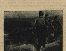
Там, небольшими группами уходили комсомольцы Мысылко выполнять боевую привяз командира. Их было не «Малой» змалеть немного, но каждый из них стоил пятачку.