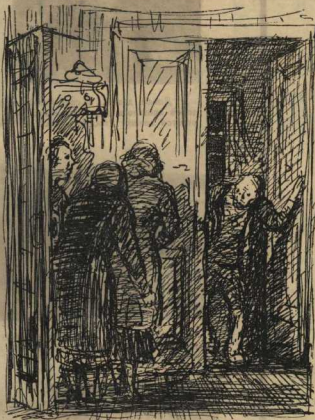
Не растерявшись, старик загворил следящим голосом...

какое ей дело до этого? Враг перед ней. Враг! Это он — ВРАГ — убил её Юрия или замучил его в плену! Это он лезет, крадётся, просачивается, нападает, бьёт, жжёт, истязает и калечат её город, её землю — плодородную и цветущую!