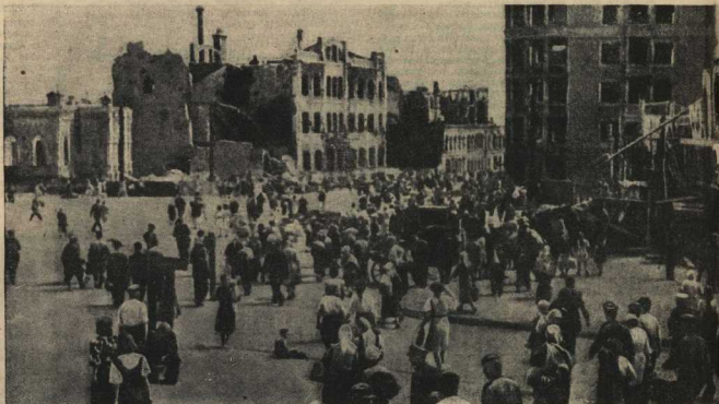
На улицах стало многолюдно. Население славного волжского города увеличивается с каждым днём.