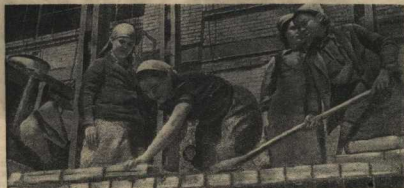
Здесь, у полуразрушенной стены, комсомолки кладут кирпичи нового Сталинграда.