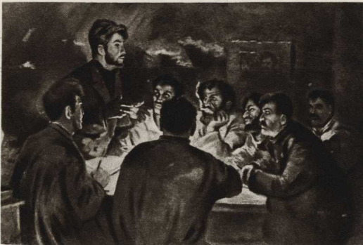
И. В. Сталин руководит марксистским кружком в Главных железнодорожных мастерских в Тифлисе. 1898 год.