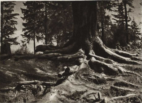
При самом выходе стояло огромное и когда-то могучее дерево...