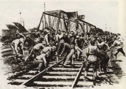
Китайский народ на восстановлении железнодорожных путей.

Рисунки М. Хмелько, лауреата Сталинской премии