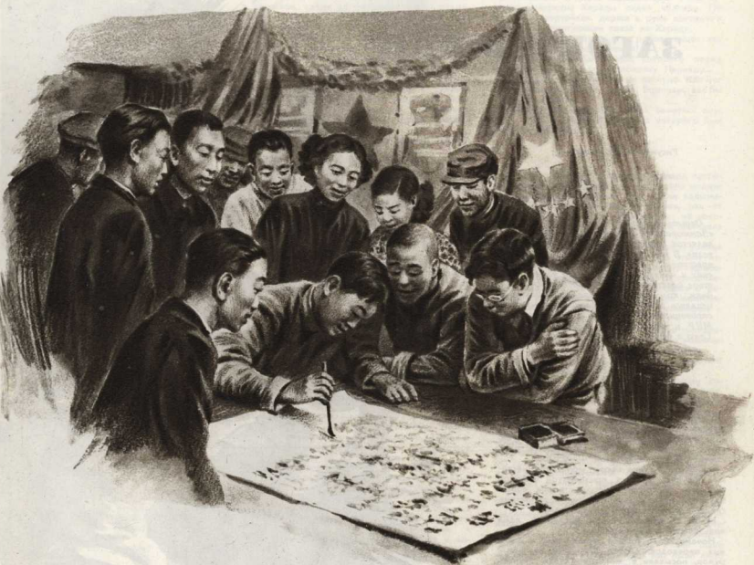
Шанхай. Члены Новодемократического союза молодежи Китая подписывают Стоунгильское воззвание о запрещении атомного оружия.

Нам не раз приходилось выступать перед китайской молодежью, рассказывать им о жизни советских людей, об их борьбе за всеобщее счастье и мир во всём мире.