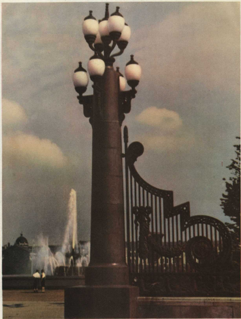
Москва. Сквер на Болотной улице.