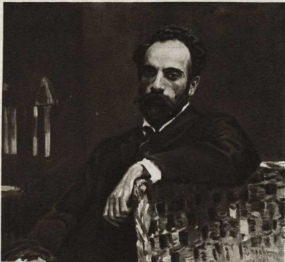
М. И. Левитан.