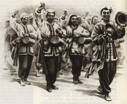
Пекин. На демонстрации молодёжи. Ввод барабанищной.