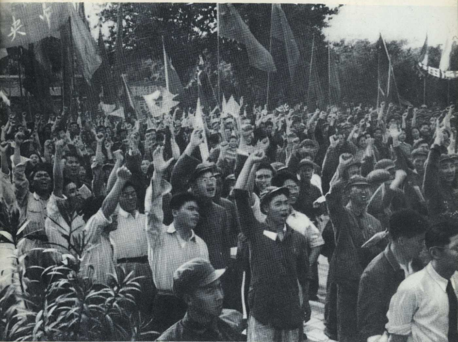
Массовый митинг в защиту мира в Пекине, в парке имени Сун Ят-сена.