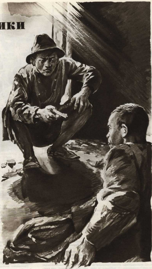
...Напротив Хареды сидел человек. Он сидел на мурочках, держа в руке пистолет.

Отрывок из нового романа Ник. Шпанова «Заговорщики». Тематически новый роман является продолжением романа «Поджигатели». В нём автор разоблачает закладную преступную деятельность англо-американских и немецких поджигателей войны. Действие пещерного отрывка относится к тем дням, когда американские империалисты, цепляясь за китайский плацдарм, пытались спровоцировать военное столкновение с МНР и таким образом овладеть Советским Союз в войну.