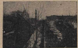
Над освобождённым Моздоком плывёт на ветру красное полотнище — знак возрождения жизни.