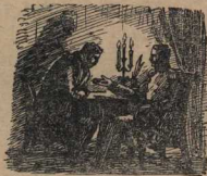
За беседой сесты и хозяин не заметил, как быстро пролетело время.

Из литой булгунной стали на заводе самострианы кирасы, которые, как рубашка, прилеплялись на тело, и при стрельбе на полсотню шагов пули не пробивали их. В глухих горах Обухов испытывал