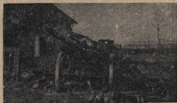
Под ударами Красной Армии немцы бежали с Северного Кавказа, оставив после себя руины и пепелища, подбитые орудия и танки.