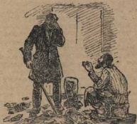
Он раздробил тигли в мелкие куски...