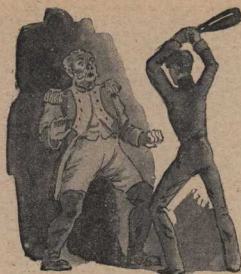
Появля обложка руками бутылки, Кахоковский изо всех сил ударил её по режеей колоде бавааря.

Несподовно появившись по карманам и в ящиках бифора, и не найдя там титонора, баваар вдруг требовательно обратился к Кахоковскому: