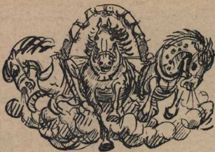
Старинная русская песня