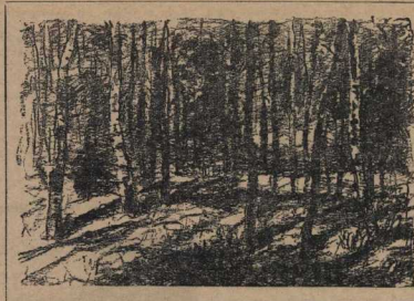
Иллюстрация И. БЕРЕНДГО

Мне снится полдень деревень, Где листья в солнечном сплетенье, Где поляны проливаются сень, Струит узорчатые тени.