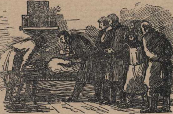
Так и умер он, унес секрет в могилу.

Солдаты взяли из ящика гладкую чугунную бомбу и торжественно вкатили в дуло. Старший фейерверкер скомандовал: