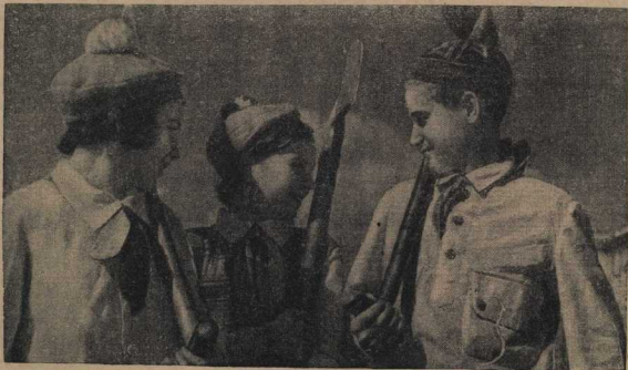
ЛЕНИНГРАД СЕГОДНЯ. На город!

— Лётчик, — сердито ответил Быков и отвернулся.