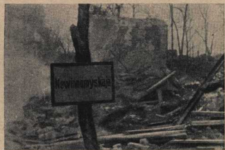
Реплиции о мести камин — следы нашествия гуинов — немцев встали надпись — вот всё, что наши советские воины из станиц Невинномысск.