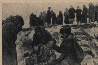
Сколько их, мирных советских жителей, обманутых и зверски расстрелянных немцами! В глубоких противотанковых рвах люди находят трупы близких, и сердце их наполняется жгидой мщенья.

до но всё. Часть обречённых ожидала ещё более страшная участь. Их загоняли по тридцати — сорок человек в особые, герметически закрывающиеся автомшины. Заводились моторы — и через несколько минут стихали крики несчастных, задушенных окисью углерода. Мёртвые тела сбрасывали в ямы, рыть которые гестаповцы заставляли мужчин из числа арестованных. Так в один день немцы умертвили четыре тысячи жителей Ставрополя.