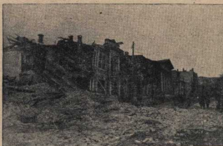
Они сожгли все лучшие здания Пятигорска — школы, больницы, жилые дома; они оставили после себя руины и смерть.