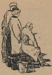
Рисунок В. Горлева