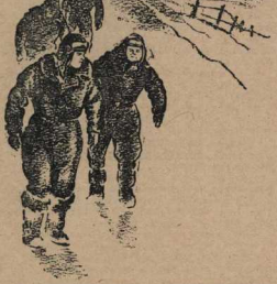
В комбинациях, деталях и шлемах они казались маркулами, как медведи...

Так кончился первый заход. Теперь уже походящие заходы они делали сверху, с широкого холма. Второе колесо на штурмовку было круче, чем в первом. Один из других извернулся от высоты между струями транспирных