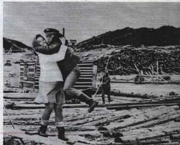
КАДРЫ ИЗ КИНОФИЛЬМОВ ЛАРИСЫ ШЕПИТЬКО: «ВОСХОЖДЕНИЕ», «ТЫ И Я», «ЗНОЙ».

Когда-то судьба улыбалась Абакиру: трудовые победы, слава, почет; сейчас от всего этого остался небольшой альбомчик с вырезками из газет, печатавших его портреты. Но за ошеломляющими цифрами рекордов никто не разглядел да и не мог разглядеть человека. Ведь если бы кто-нибудь заглянул в душу Абакира, то обнаружил там духовную черствость, грубость, эгоизм — все, что писатель назвал одним словом «байство». И в повести Абакир — олицетворение предрассудков. Шепитько по-своему переосмыслила этот образ. Ее Абакир — продукт неправомерно возвеличивания нравственно незрелого человека, уверовавшего в собственное превосходство, собственную непогрешимость.