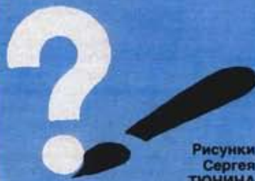
Рисунки Сергея ТЮНИНА

5. Назовите имя будущего обладателя золотой медали Олимпиады-80 в плавании на 100 метров вольным стилем среди мужчин.