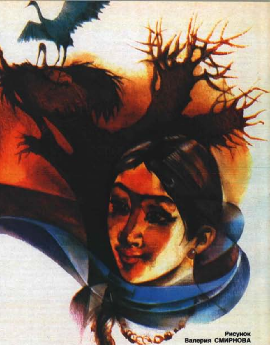
Рисунок Валерия СМЕРНОВА

Старый табунщик попросил себе два одеяла и, сославшись на хворь, один устроился спать в юрте. Остальные расположились под открытым небом.