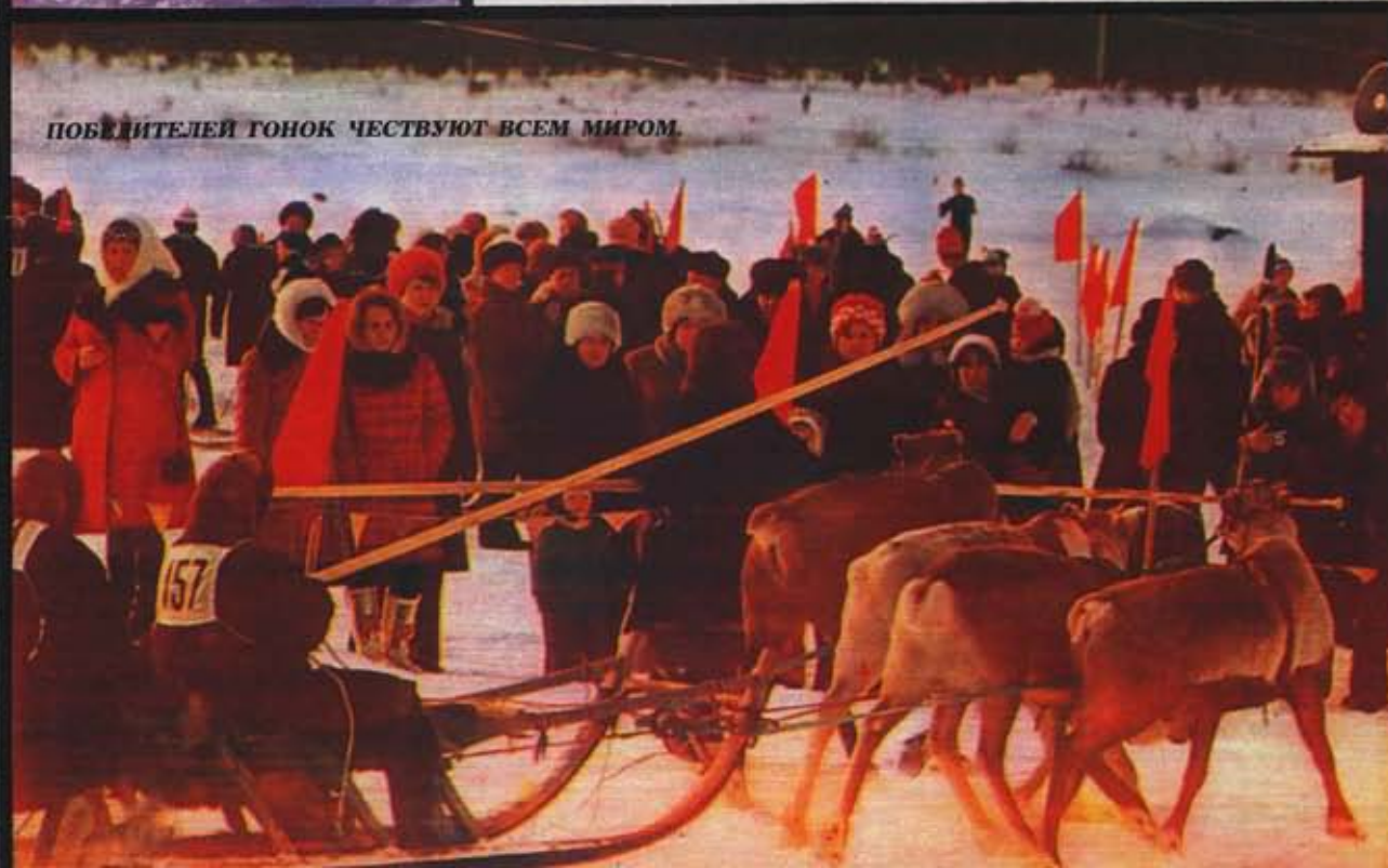
ПОБЕДИТЕЛЕЙ ГОНОК ЧЕСТВУЮТ ВСЕМ МИРОМ.