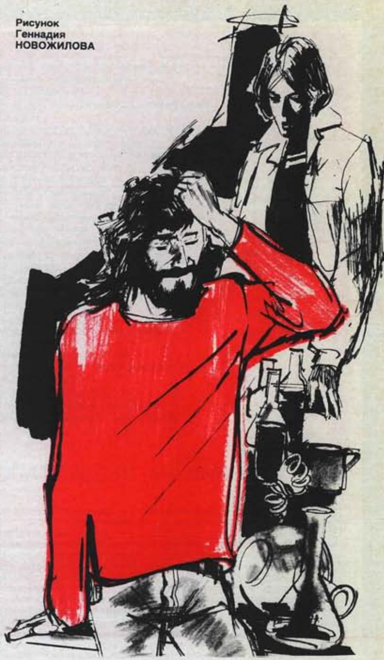
Рисунок Геннадия НОВОЖИЛОВА

рением, он дал согласие на то, чтобы судебный исполнитель взял пробу воды и на участке, принадлежавшем его отцу. Кроме того, он дал Клер адрес Ронди: мадам Ронди была дочерью Гийоме.