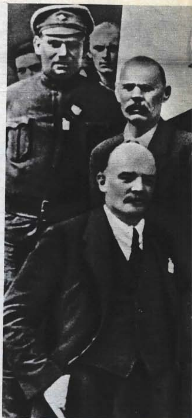
В. И. ЛЕНИН И А. М. ГОРЬКИЙ В ГРУППЕ ДЕЛЕГАТОВ II КОНГРЕССА КОМИНТЕРНА У ТАВРИЧЕСКОГО ДВОРЦА. ПЕТРОГРАД. 19 ИЮЛЯ 1920 ГОДА.

В боевой лихорадке революционной осени 1905 года зарождается их творческое содружество. Пять недель под носом у царя и всей его опричнины в Петербурге выходит легальная большевистская газета «Новая жизнь». Бразды редакторского правления — у Владимира Ильича. В работу вовлекается целая плеяда талантливых партийных публицистов — Луначарский, Ольминский, Воровский. Особое место отводится выступлениям Горького, подкрепившего большевистскую линию своими «Заметками о мещанстве». И у Владимира Ильича были все основания сказать тогда: газета стала «самой широкой трибуной для нашего воздействия на пролетариат». Из номера в номер — тринадцать статей на восемнадцать номеров — публикуются его принципиальнейшие работы: о реорганизации партии, об отношении пролетариата к крестьянству, к армии, к религии, к новым органам власти. И среди важнейших вопросов революционной страте-