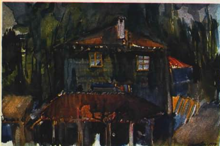
ДОМ В ДЕРЕВНЕ.