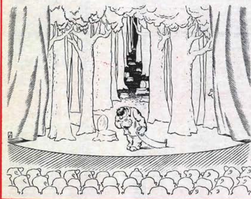
Рисунок Анатолия ОРЕХОВА