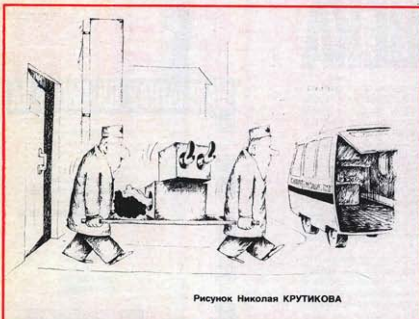
Рисунок Николая КРУТИКОВА