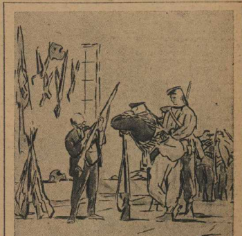
Затлок трофейной оружи.

В мерцании освещённого с улицы окна Алексей выдел белую фигуру Людмилы, сидевшей по-турецки.