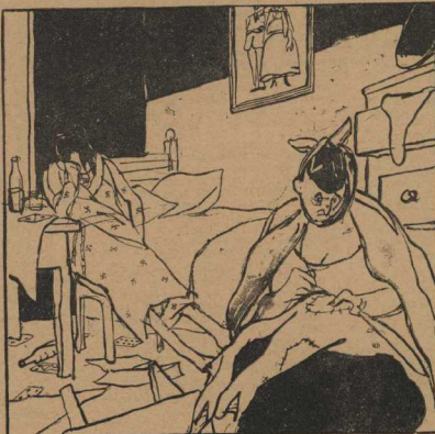
Любовь без радости была...

В 1914 году началась первая мировая война. Германия и Австро-Венгрия выступили, как и предполагалось, в союз с Францией, Англией и Россией. А Италия? Она сначала поддержала участие в войне и сохранила нейтралитет. В действительности она выжидала на чьей стороне сила, к кому выгоднее присоединиться?