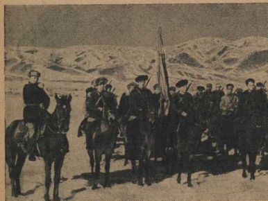
2. Последние минуты перед первым боем. Уже вернулась разведка, составил организационный план атаки. Особо важное задание поставлено перед комсомольским подразделением кавалерийского клуба. Выматательно слушают бойца последние наставления командира.

Тактические задания бойцов подразделения Всевобуча Фрунзенской области начались!