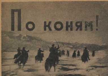
1. По заснеженным просторам предгорий Киргизии лихо мчатся молодые джигиты. Сверкают на солнце клинки, мелкая снежная пыль стелется по дорожке.

Будем же воспитывать в себе выносливость воина, искусство лыжника-бойца! Пусть кросс в честь славы и победы Красной Армии накажет нашу спорность и умение! На лыжню, на снежную целину, товарищи комсомольцы!