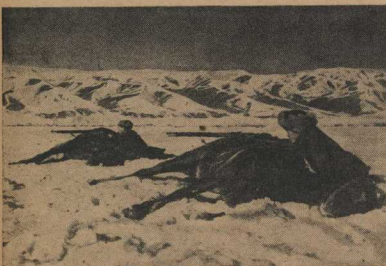
3. И грянул бой! Словно снег на голову, налетели на «протанки» комсомольцы — они вросли и победили. Метким огнем с фланга встретили 120 джигиты, организующие засаду на дорожке.