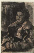
П. Мальяков, «Партизанка».

— А почему порядка у вас нет? Словно бы без дела; кто хочет, тот коммивояжёр; грязь в цехах. Как рабочие, го-