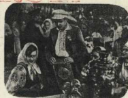
«БОГАТАЯ НЕВЕСТА» А.