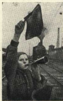
«Грудам фронта — дорогу!» На одну минуту не задержит их комсомола Цына Сивридонна.

сформировались в 1942 году по призыву дежурных трактористов Свердловского края.