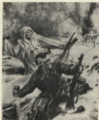
Двое из 28 героев-панфиловцев.