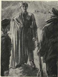
Снайпер Людмила Павличенко.