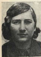
Герой Советского Союза Лиза Чайкина.

Образы этих героинь вошли в нашу жизнь. Они освещают наш путь. И вместе с тем мы чувствуем их близость, их жажду тепла, особенности каждой из них — голоса, походку. Мы знаем их, как своих добрых знакомых.