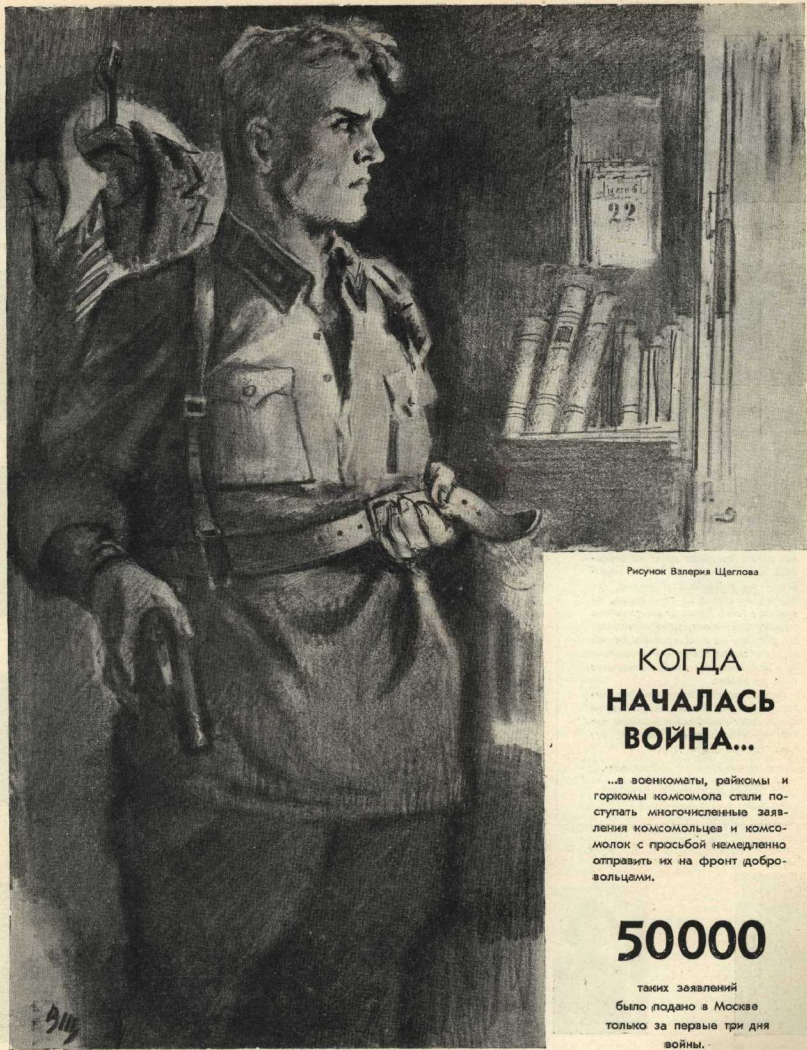
Рисунок Валерия Щеглова