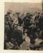
Худ. А. Буево

«Намечта первого показавшегося ему серьёзным молодого рабочего. Орджинокое наздравился к нему. Ему хотелось выписати, справедливее ли все эти переканки на несумелости и текучесть новых работников. Тот, к кому он подошёл, внимательно посмотрел на него и вытер руки тряпкой, лежащей подле него на столе. Это был Грожек, работавший а то время бригадиром коробки скреостей.