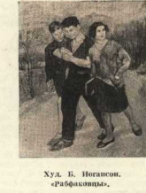
Худ. В. Иогансон. «Графкоманы».

тьма-то, тьма-то... Я вядк тихоко ногу выставил... Гляжу — на земле, вышел у самого сарая, а за углом — как есть, часовой стоит... Лёг на брюхо, думаю — проползти надо сначала, чтобы его разглядеть — голову выколдил — спит, может, думаю... Вздв тут крикнул — из сарая дали, а как доплел к нему, да как красну его, да по лиску его. Ключи ую, сердечный, а земдо и крикнути не знал што... А я его ещё раза четыре стукнул — забрызгался кровью, истаскался... Вышел им всей артелью, сарай-то с краю был... Мы тут ползком, всё ползком, так и ушли непримеченные... Знали, где от своих отбился, вавили... Э-эх, тоже страху было!»