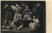
М. Светлов, «Двадцать лет спустя».

— А вы кто такой будете? — желалю осомедлала Грожек, попрержежу вымателюко разглядывая Серго и его секретаря.