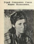
Герой Советского Союза Женя Полтавская.