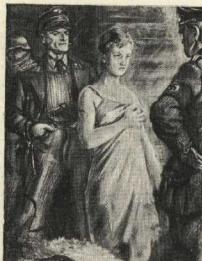
Герой Советского Союза Зоя Космодемьянская на допросе.