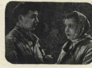
«ОНА ЗАЩИЩАЕТ РОДИНУ».