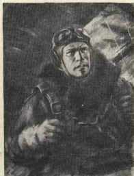
Дважды Герой Советского Союза Борис Сафонов в кабине самолёта.