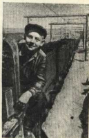
Мчит в бункер Волода Рабочий свой состав. Он горноучился в ФЗО и стал отличником мининистом.