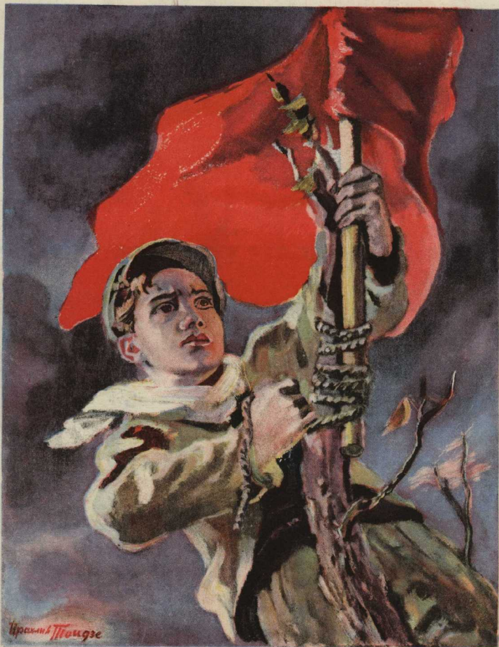
ЗНАМЯ НАД КРАСНОДОНОМ.