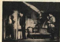
К. Симонов. «Парень из нашего города».

— Я — Рожков, бригадир кораблей скоростей. Вот види-