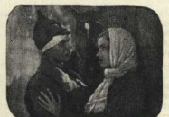
«КАК ЗАКАЛЯЛАСЬ СТАЛЬ»