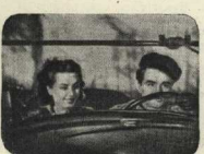
«М А Ш Е Н Ъ К А»

Нас волна молодость В сабельный поход, Нас бросала молодость На кронштадтский лёд