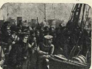
«МЫ ИЗ КРОНШТАДТА»