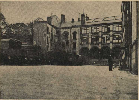
Эту норвежскую школу немцы завоеватели превратили в гараж автомашин, награбленных у норвежцев.

И это чувство разделяла с мальчиком его новая семья.