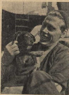
Молодой моряк Свободной Норвегии.